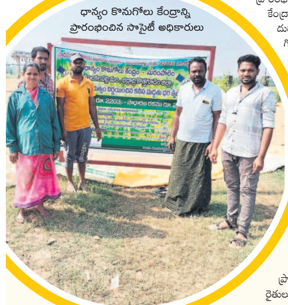
ధాన్యం కొనుగోలు కేంద్రాన్ని ప్రారంభించిన సానైటీ అధికారులు

క్వింటాళ్లు, మంజీల్ కాటన్ మిల్ సెంటర్లో 1,381 క్వింటాళ్లు, శ్రీశివ కాటన్ మిల్లో 887 క్వింటాళ్లు, ఉషశ్రీ కాటన్ మిల్లో 2,295 క్వింటాళ్లు, ఎంఎస్ స్ట్రక్చర్స్ జిస్సింగ్ మిల్లో 793 క్వింటాళ్లు, అలాగే, జిఆర్ఆర్ జిస్సింగ్ మిల్ల ద్వారా 2,604 క్వింటాళ్లు, శ్రీజాగ్గలక్ష్మి కాటన్ మిల్ల ద్వారా 1,056 క్వింటాళ్లను సీసీఐ బయ్యర్లు కొనుగోలు చేశారు. మొత్తం పది కేంద్రాలను ఏర్పాటు చేయగా వాటిలో రెండు సీసీఐ కేంద్రాల్లో శుభ్ర వారం నాటికి క్రయవిక్రయాలు ప్రారంభం కాలేదు. మిగిలిన 8 కేంద్రాల్లో మాత్రమే సీసీఐ ఖరీదుదారులు పంటను కొనుగోలు చేస్తున్నారు. ఏటా ప్రారంభం నుంచి చివరి వరకు సీసీఐ సుమారుగా