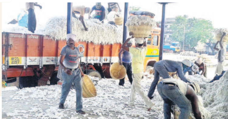
సీసీఐ కేంద్రానికి రైతులు తీసుకువచ్చిన పత్తిపంట (ఫైల్)

ఖమ్మం వ్యవసాయం, డిసెంబర్ 8: భారత పత్తి సంస్థ (సీసీఐ) ఖమ్మం జిల్లా వ్యాప్తంగా ఇప్పటి వరకు 12,590 క్వింటాళ్ల పత్తిపంటను కొనుగోలు చేసింది. కలెక్టర్ వీపీ గౌతమ్ ఆదేశాల మేరకు కొద్ది రోజుల క్రితమే జిల్లా మార్కెటింగ్ శాఖ జిల్లాలో 10 సీసీఐ కేంద్రాలను ఏర్పాటు చేసింది. ఖమ్మం వ్యవసాయ మార్కెట్ పరిధిలో మూడు, మధిర ఏఎంసీ పరిధిలో మూడు, మద్దూరు పరిధిలో ఏఎంసీ పరిధిలో రెండు, నేలకొండపల్లి, వైరా ఏఎంసీ పరిధిలో ఒక్కొక్కటి వాహుని కొనుగోలు కేంద్రాలను ఏర్పాటు చేశారు. వీటిలో జిఆర్ఆర్ జిస్సింగ్ మిల్ సెంటర్లో 1,469 క్వింటాళ్లు, అమరావతి టెక్స్టైల్స్ జిస్సింగ్ మిల్లో 2,162