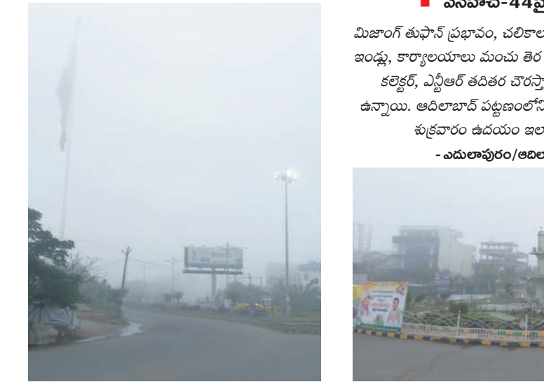
ఆదిలాబాద్ నుంచి నాగపూర్ కు వెళ్లే జాతీయ 44 రహదారిపై కమ్మం కున్న పాగమంచు