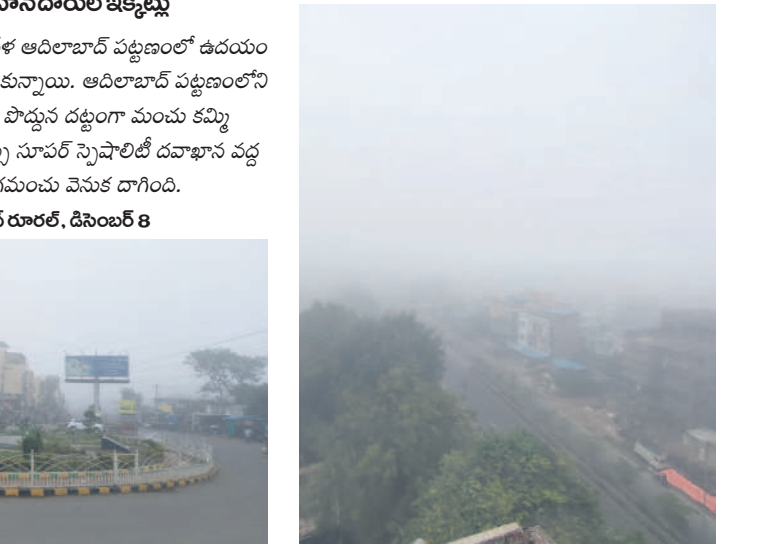
ఆదిలాబాద్ పట్టణంలో కమ్మం కున్న పాగమంచు

గూడెంలో వైభవంగా కార్తీక బహుళ ఏకాదశి 393 జంటల సామూహిక సత్యనారాయణస్వామి వ్రతాలు దండేపల్లి, డిసెంబర్ 8 : దండేపల్లి మండలం గూడెం రహసాహిత్య ఆలయంలో కార్తీక బహుళ ఏకాదశి పక్కన సంవత్సరంగా శుభవారం భక్తుల రక్షి కోససాగింది. ఆయా ప్రాంతాల నుంచి వేలాదిగా తరలివచ్చిన ప్రజలు ముందుగా పవిత్ర గోదావరి నదిలో పుణ్య స్నానాలు ఆచరించారు. గోదావరిలో కార్తీక దీపాలు వదిలి గంగమ్మ తల్లికి పూజలు చేశారు. అనంతరం గట్టు కింద రావి చెట్టు వద్ద, గుట్ట పైన గల ధ్యానస్థంభం వద్ద మహిళలు కార్తీక దీపాలు వెలిగించారు. అనంతరం స్వామి వారిని దర్శించుకొని తీర్థ ప్రసాదాలు స్వీకరించారు. 393 మంది సామూహిక సత్యనారాయణస్వామి వ్రతాలు ఆచరించారు. అనంతరం అభిషేకాలు, అర్చనలు ప్రత్యేక పూజలు చేశారు. ప్రతాళ కోసం ప్రత్యేకంగా రెండు మండపాలను ఏర్పాటు చేశారు. జైహర్షి వినోద నర్తకి దంపతులు సత్యనారాయణస్వామి ప్రతాన్ని ఆచరించారు. అర్చనలు తీర్థప్రసాదాలు, అభిషేకాలు ఆందించారు.