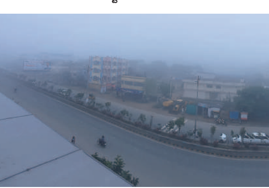
ఆదిలాబాద్ పట్టణంలో కమ్మకున్న పాగమంచు

విజాంగ్ తుపానీ ప్రభావం, చలికాలపు వేళ ఆదిలాబాద్ పట్టణంలో ఉదయం ఇండ్లు, కార్యాలయాలు మంచు తిర కప్పాకున్నాయి. ఆదిలాబాద్ పట్టణంలోని కల్లెక్కర్, ఎల్లీఆర్ తదితర చౌరస్తాలన్నీ పొద్దున దట్టంగా మంచు కమ్మి ఉన్నాయి. ఆదిలాబాద్ పట్టణంలోని డిమ్మి సూపర్ స్పెషాలిటీ దవాఖాన వద్ద ఖచ్చారం ఉదయం ఇలా పొగమంచు వెనుక దాగింది. - ఎదురాపురం/ఆదిలాబాద్ రూరల్, డిసెంబర్ 8