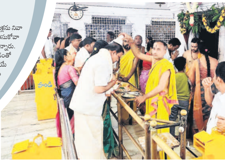
సత్యవేదం దర్శనానికి క్యూలో నిల్చున్న భక్తులు