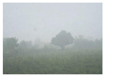
గుడిపాతూర్ మండలం సీతాగిరి వద్ద పాగమంచు