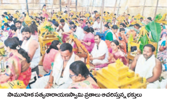
సామూహిక సత్యనారాయణస్వామి వ్రతాలు ఆచరిస్తున్న భక్తులు