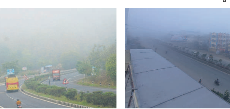
ఆదిలాబాద్ నుంచి నాగపూర్ కు వెళ్ళే జాతీయ 44 రహదారిపై కమ్మకున్న పాగమంచు