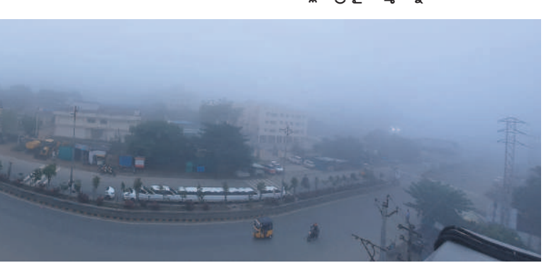
ఆదిలాబాద్ పట్టణంలో కమ్మకున్న పాగమంచు