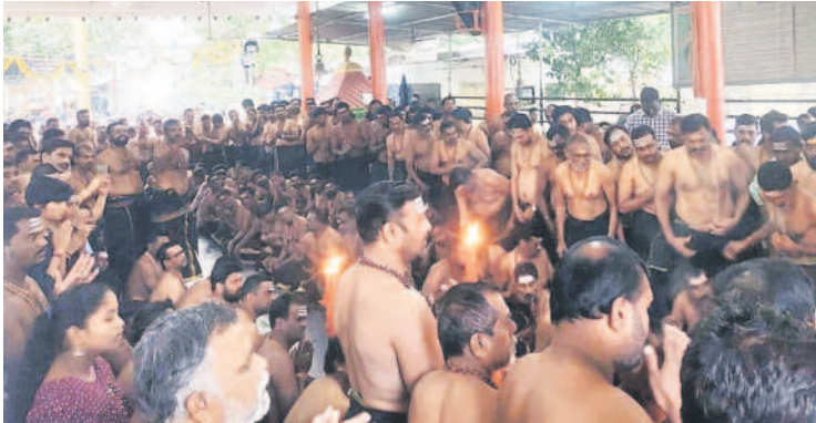
నగరంలోని అయ్యప్ప ఆలయంలో పూజలు చేస్తున్న అయ్యప్ప భక్తులు