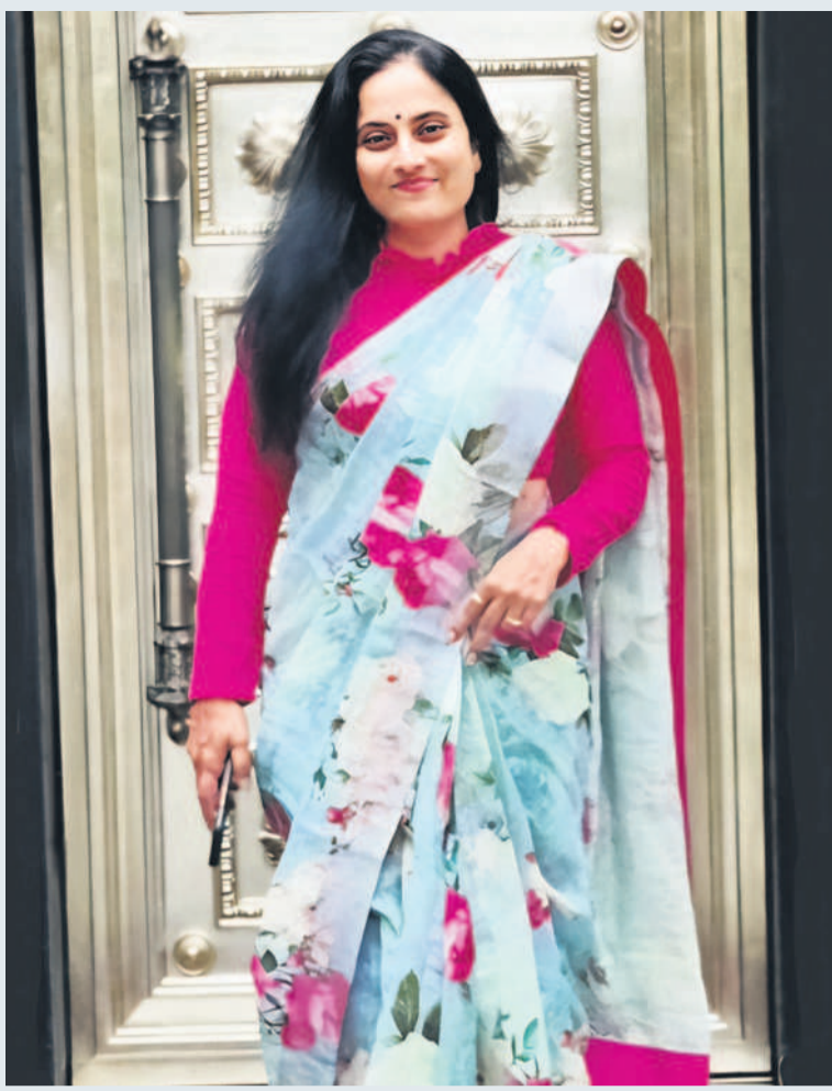
అసలే చేనేత. ఆపైన లినెన్ వస్త్రం. ఆ వీరకట్టు ఓ సాందర్య అర్పణ. పూలపూల డిజిటల్ ప్రింట్.. ఏ ఫంక్షన్కు వెళ్లినా మనస్థైర్యం ముద్దే. వేడుకలూ, ఉత్సాహాలకే కాదు.. ఆపేసుకూ కట్టుకోవచ్చు.