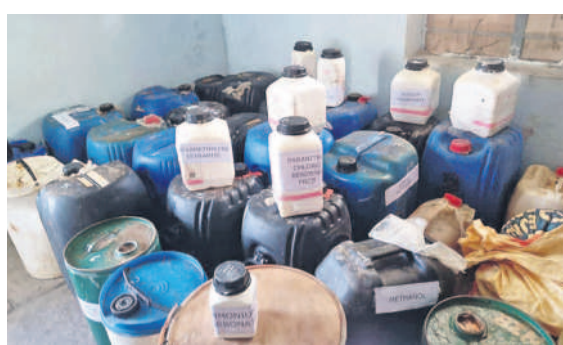
పోలీసులు స్వాధీనం చేసుకున్న డ్రగ్స్ తయారీకి వినియోగించిన ముడిపదార్థాలు