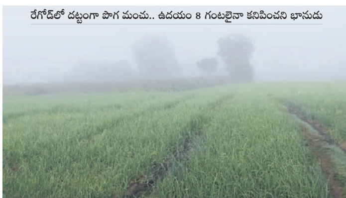
రేగోడ్లో దట్టంగా పొగ మంచు.. ఉదయం 8 గంటలైనా కనిపించని భూముడు

- న్యూస్ నెట్వర్క్, నమస్తే తెలంగాణ, డిసెంబర్ 8