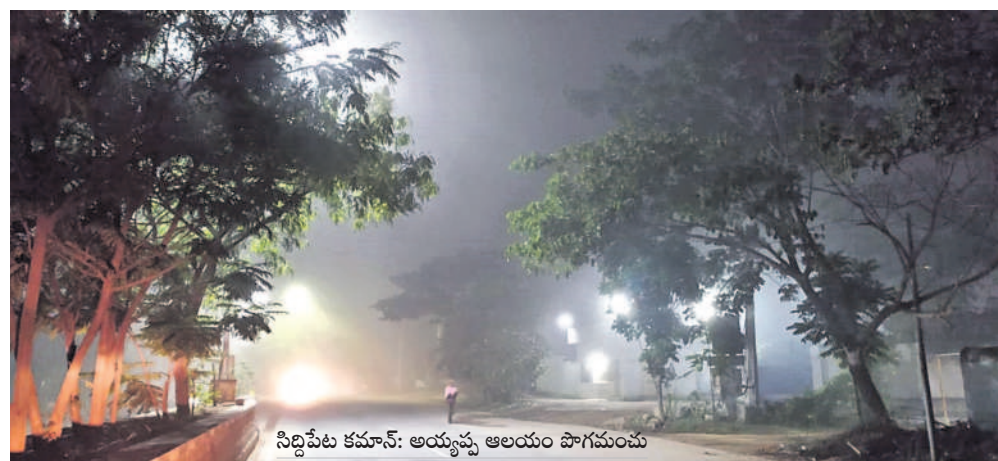
సిద్దిపేట కమాన్: అయ్యప్ప ఆలయం పొగమంచు