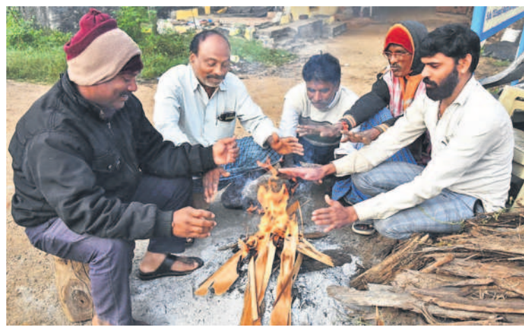
సిద్దిపేటలో చలిమంట కాచుకుంటున్న ప్రజలు