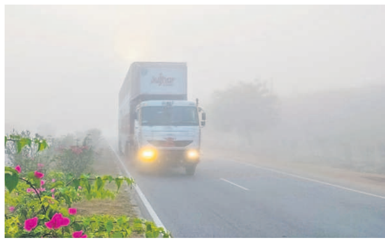
మంచుతో మునిగిపోయిన కామారెడ్డికి వెళ్లే రోడ్డు