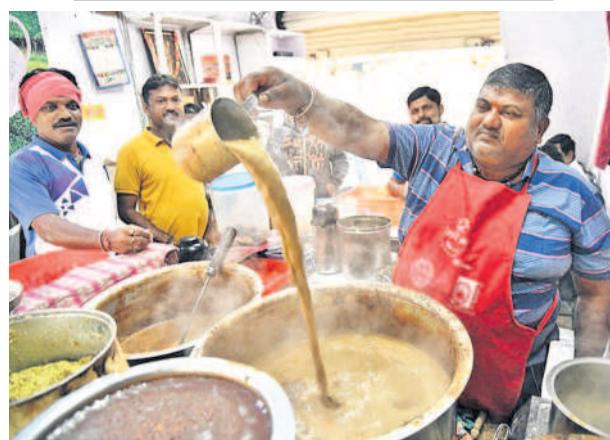
సిద్దిపేటలో టీ తాగుతున్న ప్రజలు