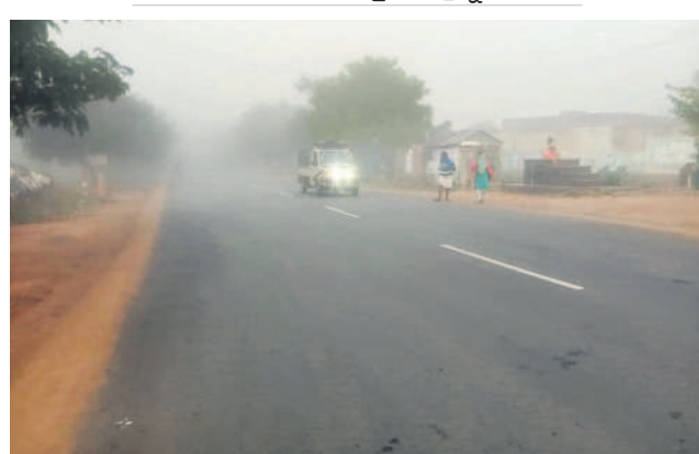
చిన్నశంకరంపేటలో పొగమంచు కమ్మేయడంతో వాహనదారుల అవస్థలు