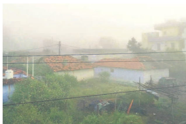
దుబ్బాక పట్టణంలో పొగమంచులోనే ఇండ్లు, భవనాలు