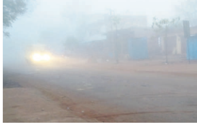
న్యాలకల్ మండలం హద్దుల్ గ్రామ శివారులోని అల్లాడుర్లం-మెటల్ కుంట రోడ్డు మార్గం గుండా లైట్లు వేసుకుని వస్తున్న వాహనదారులు