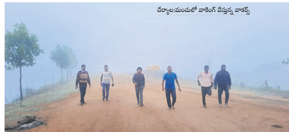
చేర్యాల:మంచులో వాకింగ్ చేస్తున్న వాకర్స్