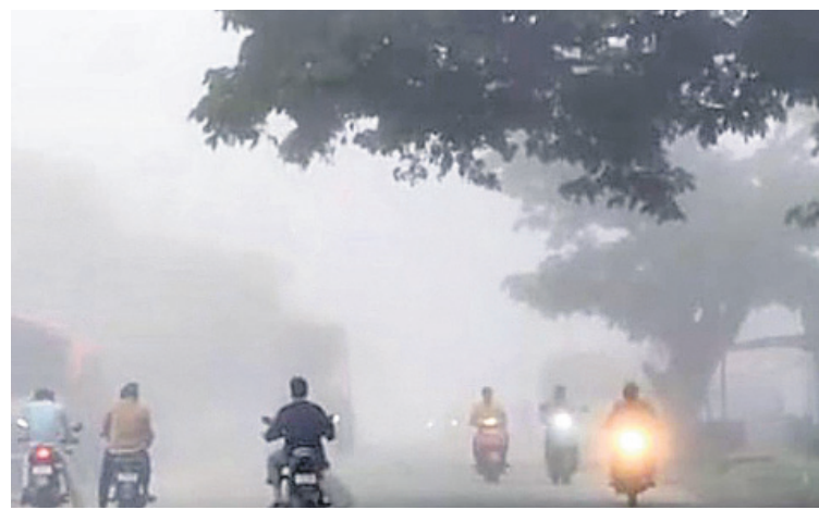
హుస్సేన్సాబ్ కుర్మాన్: హుస్సేన్సాబ్ కుర్మాన్లో పొగమంచు కమ్మేయడంతో వాహనదారుల తిప్పలు