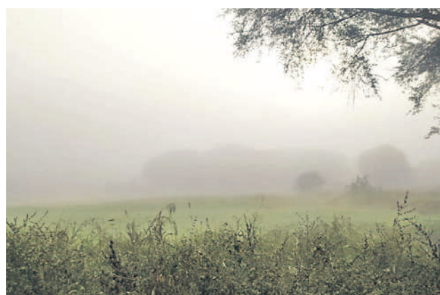
సిద్దిపేట కమాన్: సిద్దిపేట శివారులోని పొలాలలో కురుస్తున్న మంచు