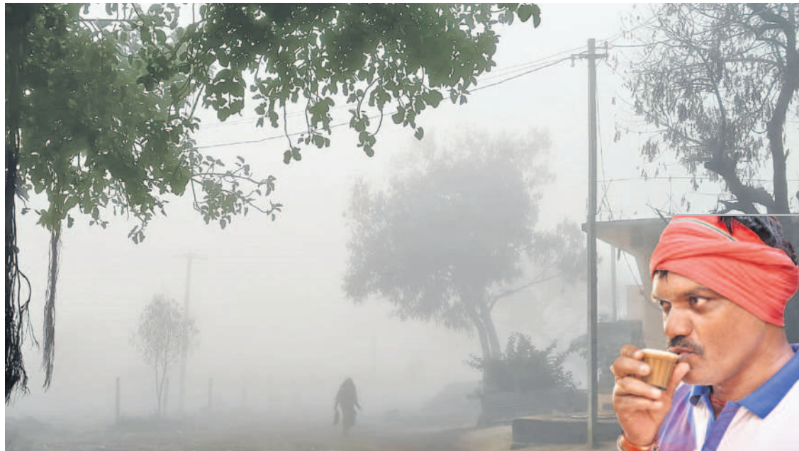
యురానంగం: బల్లిపూర్ గ్రామాన్ని కమ్మేసిన పొగమంచు