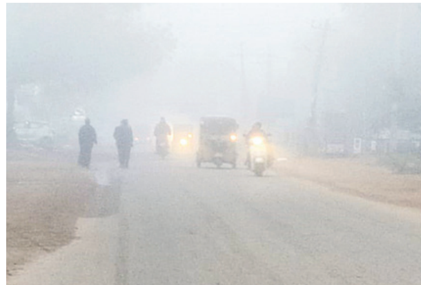
సంగారెడ్డి పట్టణంలో కమ్మేసిన పొగమంచు