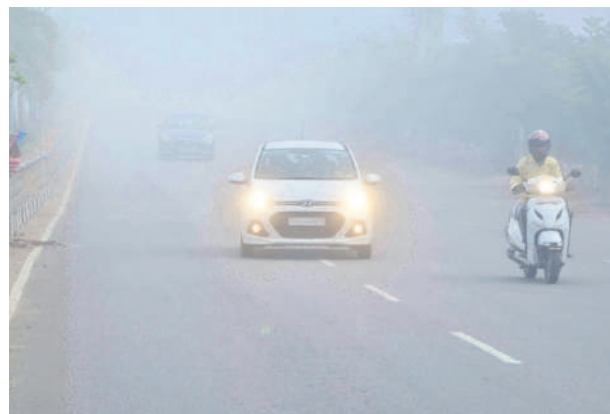
మెదక్ పట్టణంలో ఉదయం కమ్మేసిన పొగమంచు