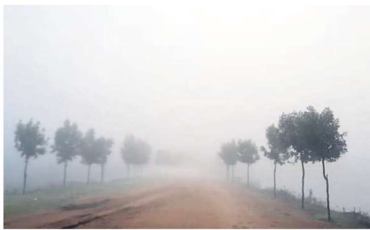
చేర్యాలలో కురుస్తున్న పొగమంచు