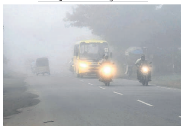
సిద్దిపేట బైపాస్ రోడ్డులో పొగమంచులో ప్రయాణిస్తున్న ప్రజలు