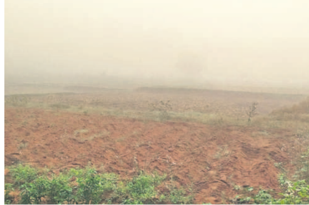
నిజాంపేటలో పంట పొలాలపై కురుస్తున్న పొగమంచు