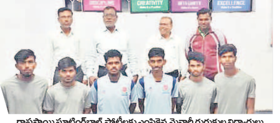
రాష్ట్రస్థాయి ఘాటింగ్ బాల్ పోటీలకు ఎంపికైన మైనార్టీ గురుకుల విద్యార్థులు