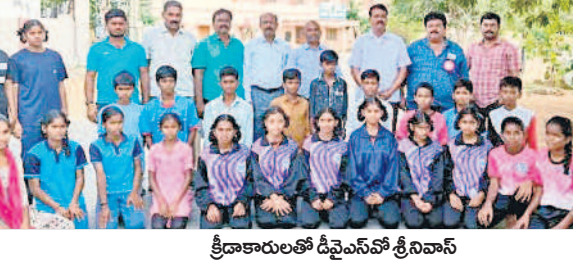
క్రీడాకారులతో డిప్యూటీ సీనియర్