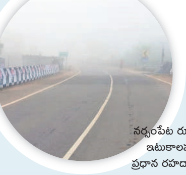
నర్సంపేట రూరల్ : ఇటుకాలపల్లి ప్రధాన రహదారిపై..