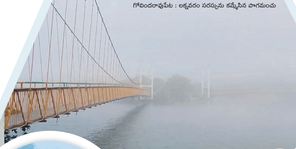
గోవిందరావుపేట : లక్షవరం సరస్సును కమ్మేసిన పొగమంచు