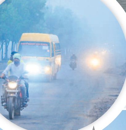
భూపాలపల్లిలో ప్రధాన రహదారిపై లైట్లు వెలుతురు ప్రయాణిస్తున్న వాహనదారులు