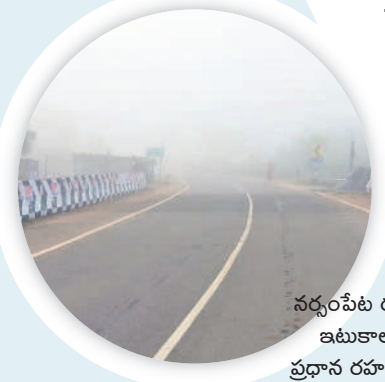
నర్సంపేట రూరల్ : ఇటుకాలపల్లి ప్రధాన రహదారిపై..