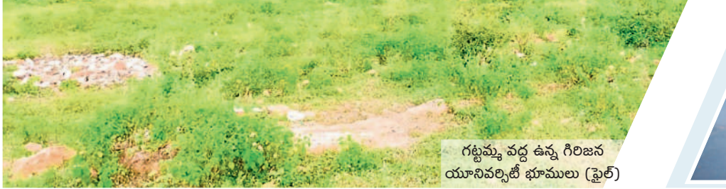
గట్టమ్మ వద్ద ఉన్న గిరిజన యూనివర్సిటీ భూములు (ఫైల్)

గోవిందరావుపేట : లక్షవరం సరస్సును కమ్మేసిన పొగమంచు