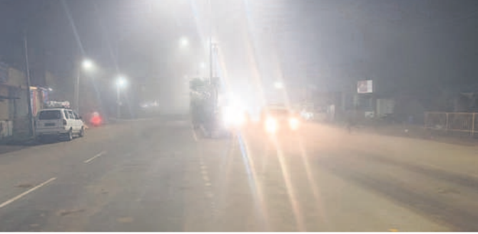
గోవిందరావుపేటలో ప్రధాన రహదారిపై..