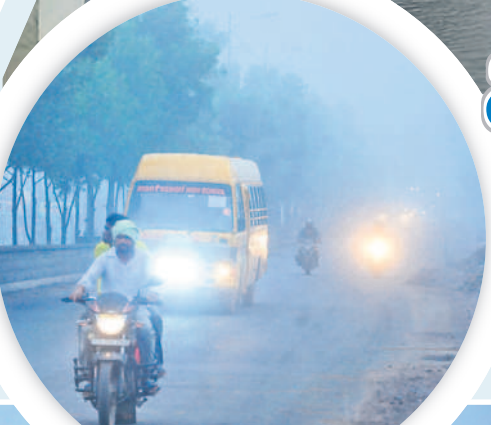
భూపాలపల్లిలో ప్రధాన రహదారిపై లైట్లు వెలుతురు ప్రయాణిస్తున్న వాహనదారులు