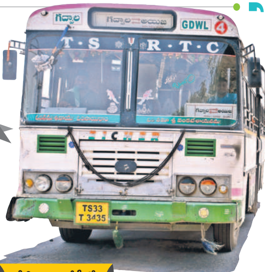
నేటి నుంచి ఆర్డీసీలో ఉచిత ప్రయాణం