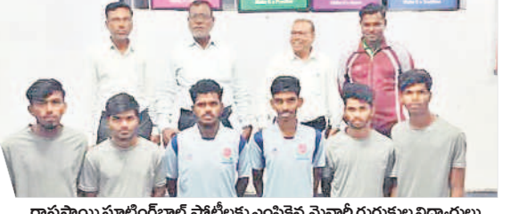
రాష్ట్రస్థాయి ఘాటింగ్ బాల్ పోటీలకు ఎంపికైన మైనార్టీ గురుకుల విద్యార్థులు