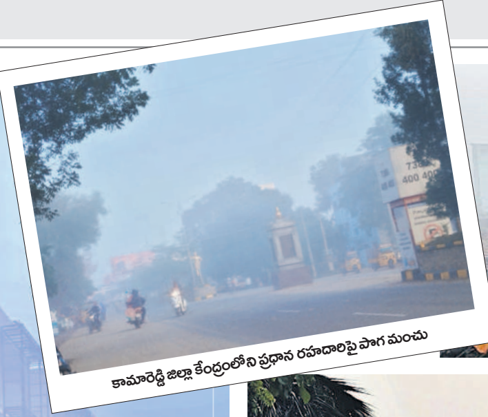
కామారెడ్డి జిల్లా కేంద్రంలోని ప్రధాన రహదారిపై పొగమంచు