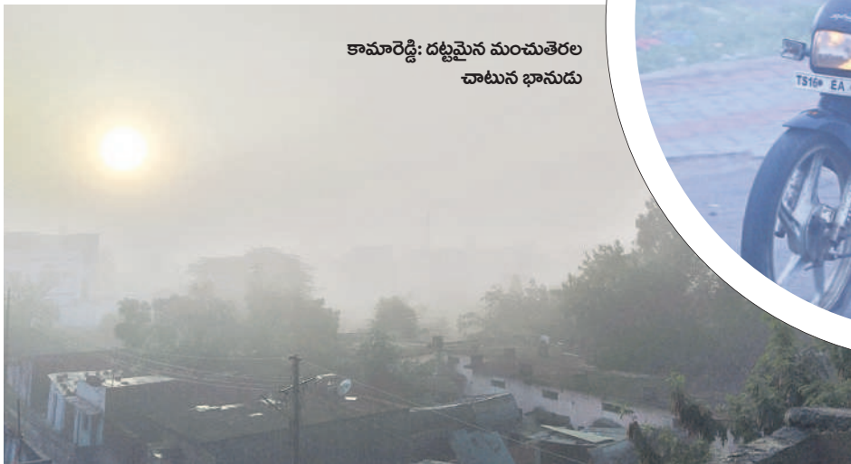
కామారెడ్డి: దట్టమైన మంచుతెరల చాటున భానుడు