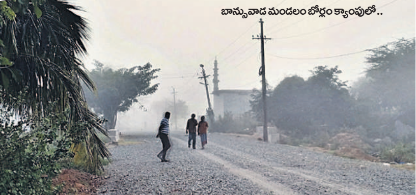
బాన్సువాడ మండలం బోర్లం క్యాంపులో..