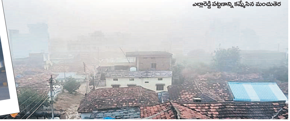
ఎల్లారెడ్డి పట్టణాన్ని కప్పేసిన మంచుతెర