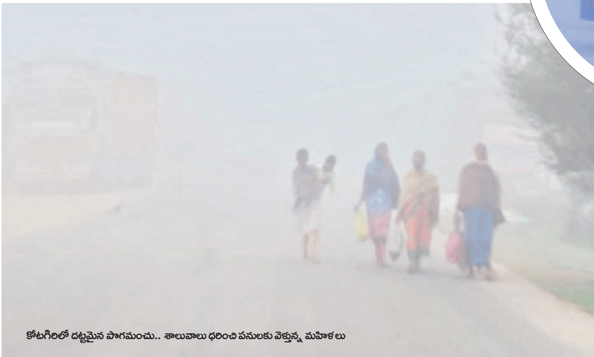
కోటిగిరిలో దట్టమైన పొగమంచు.. శాలువలు ధరించి వనలకు వెళ్తున్న మహిళలు