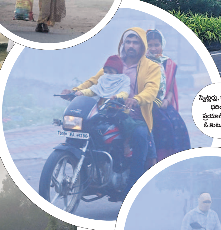
స్వెట్టర్లు, క్యాప్లు ధరించి ప్రయాణిస్తున్న ఓ కుటుంబం