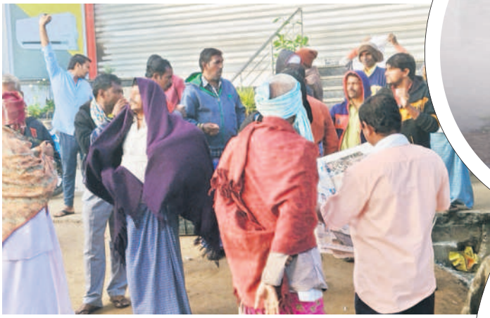
కామారెడ్డిలో స్వెట్టర్లు, శాలువలు ధరించి చారు తాగేందుకు వచ్చిన జనం