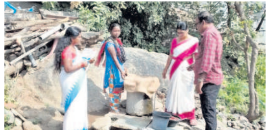
కుండీలోని నీటిని పరిశీలిస్తున్న వైద్య సిబ్బంది