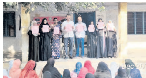
అవగాహన కల్పిస్తున్న షీటీం బృందం సభ్యులు