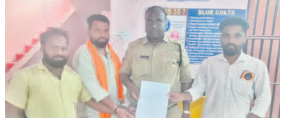
పోలీసులకు ఫిర్యాదు చేస్తున్న వైస్ ఎంపీపీ