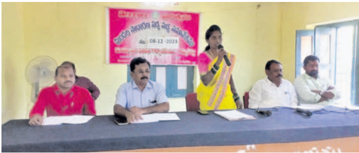
మాట్లాడుతున్న ఎంపీపీ లోలపు గౌతమీ సుమన్

తున్నదని ఎంపీపీ లోలపు గౌతమీ సుమన్ తెలిపారు. కమ్యూన్ పల్లిలోని డబుల్ బెడ్ రూం ఇండ్ల వద్ద తాగు నీటి సమస్య లేదని అధికారులు తెలిపారు. చౌట్ పల్లిలో బీసీ హాస్టల్ వద్ద డ్రైనేజీలో విద్యుత్ స్తంభం ఉండడంతో డ్రైనేజీలో మురుగు నీరు నిలిచి పారిశుధ్య సమస్య తలెత్తుతున్నదని ఎంపీపీ లోలపు గౌతమీ సుమన్ తెలిపారు.