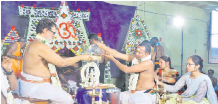
అయ్యప్ప వడిపూజ నిర్వహిస్తున్న భక్తులు