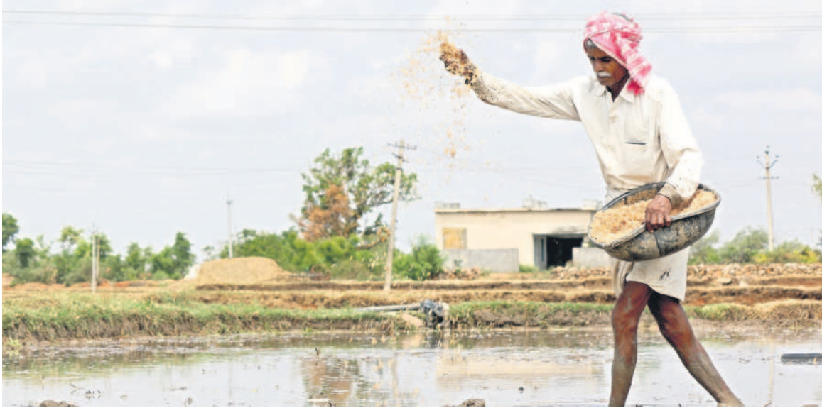
పాలంలో పరిమెలక చల్లుతున్న రైతు