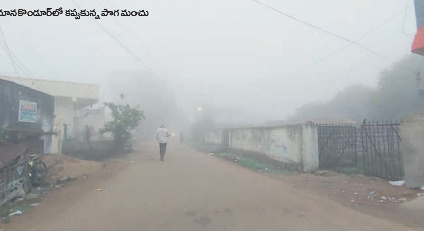
మాన కొందూర్లో కప్పకున్న పొగ మంచు