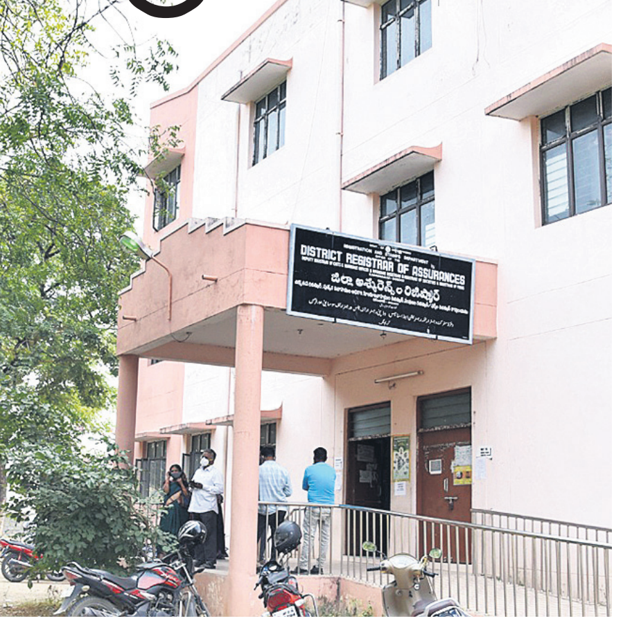
స్థంభులు, రిజిస్ట్రేషన్ శాఖ కార్యాలయము

అసెంబ్లీ ఎన్నికల నేపథ్యంలో రెండు నెలలుగా మందగించిన భూముల కొనుగోళ్లు ఇప్పుడిప్పుడే పుంజుకుంటున్నాయి. ఎన్నికల కోడ్ తో స్థిరాస్తుల క్రయవిక్రయాలు మందగించగా, అత్యధికశాతం రిజిస్ట్రేషన్లు ఆగిపోయాయి. తిరిగి ఈ నెల 4న సాయంత్రం నుంచి ఎన్నికల కోడ్ ముగియడంతో సబ్ రిజిస్ట్రార్ కార్యాలయాలు మళ్లీ బిజీగా మారాయి. నాలుగు రోజుల నుంచి భూముల క్రయవిక్రయాలు పెరుగుతుండగా, కొనుగోలు, అమ్మకందారుల రాకపోకలతో కకకలాదుతున్నాయి.