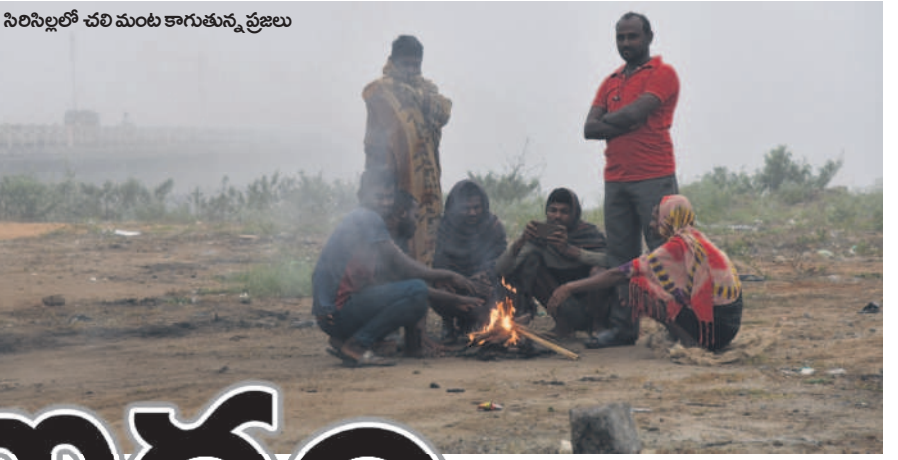
సిరిసిల్లలో చలి మంట కాగుతున్న ప్రజలు