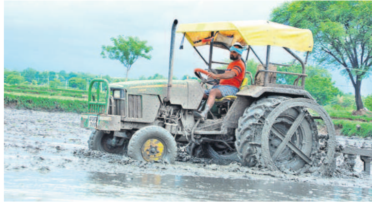
పాలం దున్నుతున్న రైతు

రాజన్నసిరిసిల్ల, డిసెంబర్ 8 (నమస్తే తెలంగాణ): ఒక పక్క వానకాలం పంట ఉత్పత్తులను విక్రయం సుస్తానే జిల్లా రైతులు యాసంగి సాగులో నిమగ్నమై యార్లు. తుఫాన్ ప్రభావంతో ధాన్యం విక్రయాలకు కొంత అంతరాయం కలిగినా జిల్లా యంత్రాంగం అప్రమత్తమై కొనుగోళ్లను వేగవంతం చేసింది. ఇటు యాసంగి సాగు రైతులు వరి నార్లు పోసుకుంటున్నారు. హుజూరాబాద్, సిరిసిల్ల, జగిత్యాల, కాల్వశ్రీరాంపూర్, ఓదెల, సుల్తాన్బాద్, ఎలిగేడు మండలాల్లో ఇప్పటికే రైతులు నార్లు వేస్తున్నారు. మక్క, ఆరుతడి పంటలు కూడా సాగువుతున్నాయి. ఈసారి కూడా వ్యవసాయ అధికారులు వరికి ప్రాధాన్యత ఇచ్చి ప్రణాళిక రూపొందించారు. వర్షాలు అనుకూలించి, భూగర్భ జలాలు పుష్కలంగా ఉన్న ప్రాంతాల్లో బావులు, బోర్ల కింద పద్ద మొక్కలలో వరి సాగుయ్యే అవకాశాలు కనిపిస్తున్నాయి. ప్రాజెక్టులో కూడా ఆసు కూలంగా నీరు ఉన్నందున ఆయకట్టు, చెరువుల పారకం ప్రాంతాల్లో కూడా వరి సాగు విస్తరించే అవకాశాలు ఉన్నాయి. ఈ నేపథ్యంలో రైతులు ఎక్కువగా వరికి మొగ్గు చూపుతున్నారు. అధికారులు కూడా అందుకు తగినట్లుగానే ప్రణాళిక సిద్ధం చేశారు.