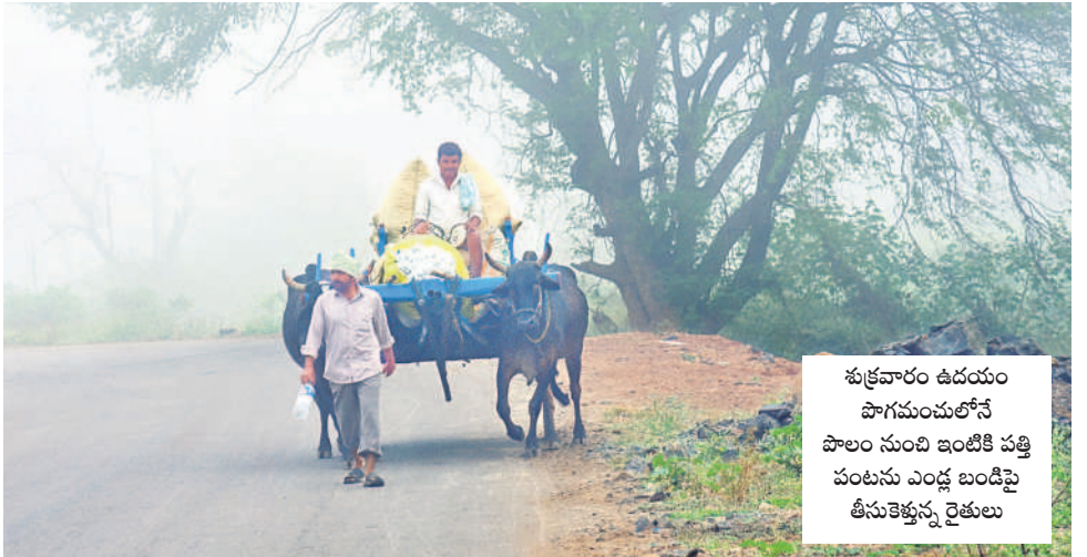
శుక్రవారం ఉదయం షాగమంచులోనే పంటను ఎండ్ల ఇంటిపై తీసుకెళ్తున్న రైతులు