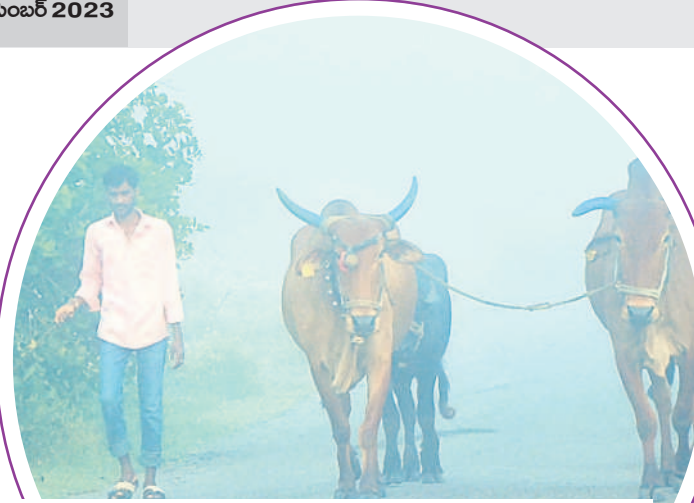
శంకర్ పల్లి మండలంలోని పర్వేషలో ఉదయం దట్టమైన షాగ మంచు కురుస్తుండడంతో ఎండ్లు, బుర్రలతో తిరిగి ఇంటికి వెళ్తున్న రైతు