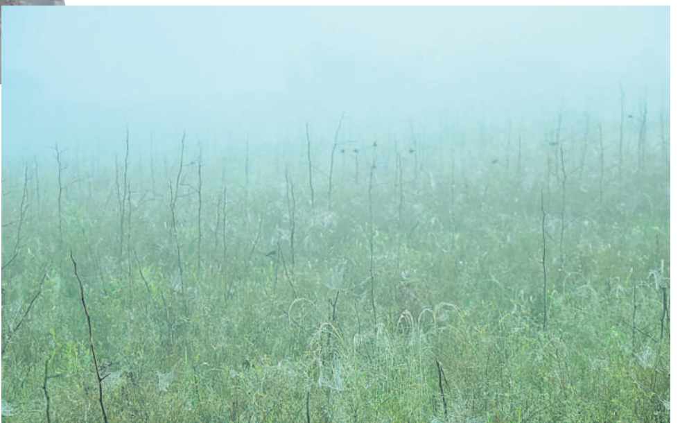
శంకర్ పల్లి మండలంలోని ఓ షాలలో శుక్రవారం ఉదయం కురుస్తున్న దట్టమైన షాగమంచు