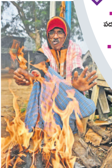
సిద్దిపేట పట్టణంలో చలికాచుకుంటున్న వృద్ధుడు