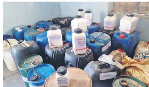
పోలీసులు స్వాధీనం చేసుకున్న డ్రగ్స్ తయారీకి వినియోగించిన ముడిపదార్థాలు