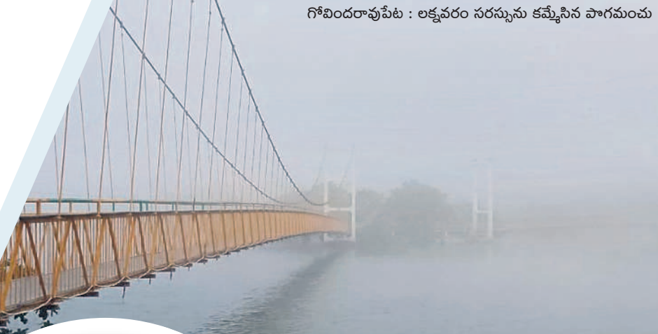
గోవిందరావుపేట : లక్షవరం సరస్సును కమ్మేసిన పొగమంచు