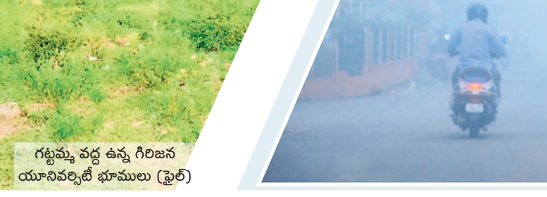
గట్టమ్మ వద్ద ఉన్న గిరిజన యూనివర్సిటీ భూములు (ఫైల్)

జీఆర్ఎస్ కృషి వల్లే.. ఎంపీ మాలిక్ కవిత మానుకోవాలి పార్లమెంట్ పరిధిలోని ములుగు జిల్లాలో గిరిజన యూనివర్సిటీ ఏర్పాటుకు రోక సభ ఆమోదం లభించడం సంతోషంగా ఉంది. యూనివర్సిటీలో ఈ ప్రాంత గిరిజన విద్యార్థులకు ఎంతో ప్రజయోజనం కలుగుతుంది. గతంలో కేసిఆర్ నాయకత్వంలో కేంద్రానికి బీఆర్ఎస్ ఎంపీలు అనేక మార్లు విన్నవించడం వల్లే ఇప్పుడు కల సాకారమవుతున్నది. యూనివర్సిటీ ఏర్పాటు విషయం విభజన చట్టంలో స్పష్టంగా ఉన్నా ఈ ప్రాంతవాసులను కేంద్ర ప్రభుత్వం కాలయాపనతో ఇబ్బంది పెట్టింది. ఇప్పటికైనా ఈ ప్రాంత వాసుల కోరిక నెరవేరుతున్నందుకు ఆనందంగా ఉంది.