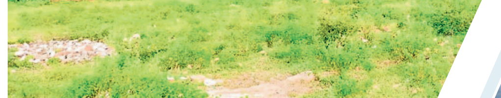
గట్టమ్మ వద్ద ఉన్న గిరిజన యూనివర్సిటీ భూములు (ఫైల్)