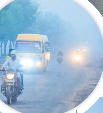
భూపాలపల్లిలో ప్రధాన రహదారిపై లైట్లు వెలుతురు ప్రయాణిస్తున్న వాహనదారులు