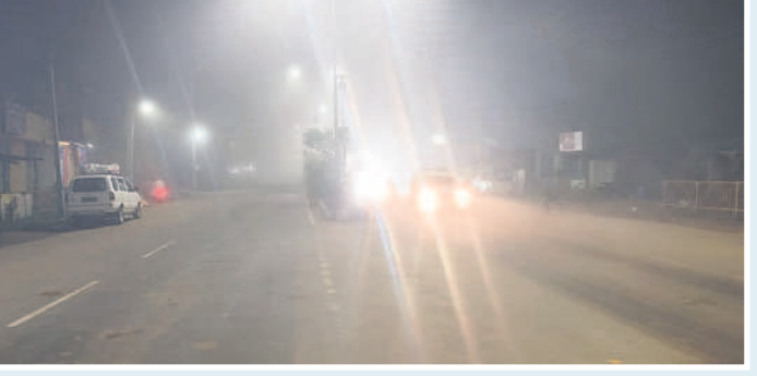
గోవిందరావుపేటలో ప్రధాన రహదారిపై..