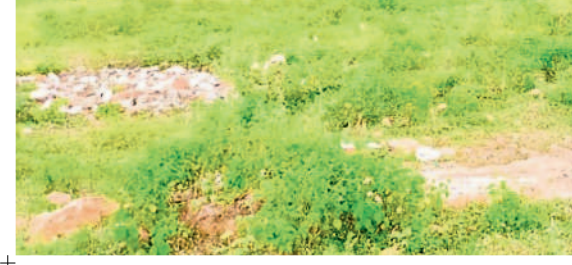
గట్టమ్మ వద్ద ఉన్న గిరిజన యూనివర్సిటీ భూములు (ఫైల్)

బీఆర్ఎస్ కృషి వల్లే... ఎంపీ మాలోక్ కవిత మానుకోట పార్లమెంట్ పరిధిలోని ములుగు జిల్లాలో గిరిజన యూనివర్సిటీ ఏర్పాటుకు లోకోసభ ఆమోదం లభించడం సంతోషంగా ఉంది. యూనివర్సిటీలో ఈ ప్రాంత గిరిజన విద్యార్థులకు ఎంతో ప్రజయోజనం కలుగుతుంది. గతంలో కేసీఆర్ నాయకత్వంలో కేంద్రానికి బీఆర్ఎస్ ఎంపీలు అనేక మార్లు విన్నవించడం వల్లే ఇప్పుడు కల సాకారమవుతున్నది. యూనివర్సిటీ ఏర్పాటు విషయం విభజన చట్టంలో స్పష్టంగా ఉన్నా ఈ ప్రాంతవాసులను కేంద్ర ప్రభుత్వం కాలయాపనతో ఇబ్బంది పెట్టింది. ఇప్పటికైనా ఈ ప్రాంత వాసుల కోరిక నెరవేరుతున్నందుకు ఆనందంగా ఉంది.