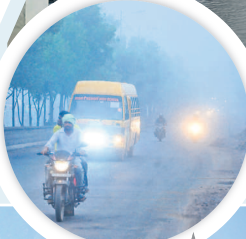
భూపాలపల్లిలో ప్రధాన రహదారిపై లైట్లు వెలుతురు ప్రయాణిస్తున్న వాహనదారులు