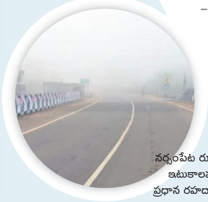
నర్సంపేట రూరల్ : ఇటుకాలపల్లి ప్రధాన రహదారిపై..