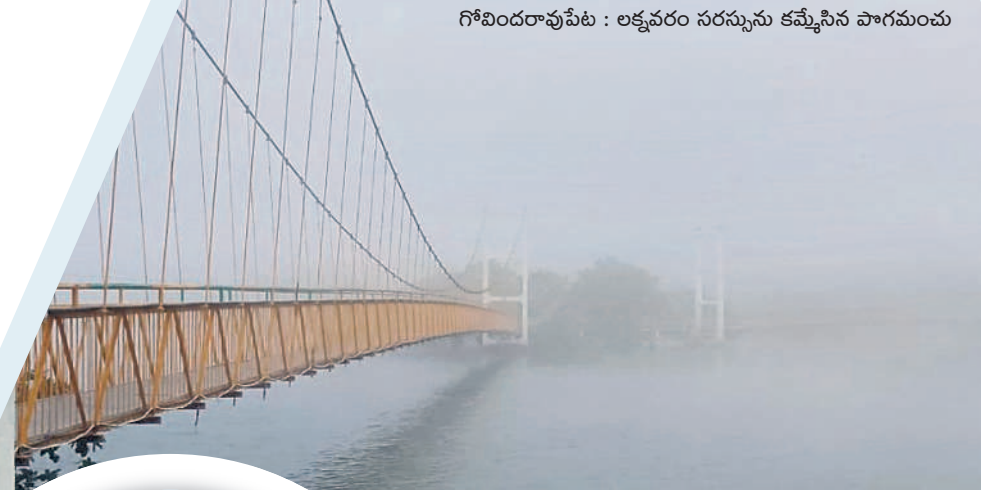
గోవిందరావుపేట : లక్షవరం సరస్సును కమ్మేసిన పొగమంచు