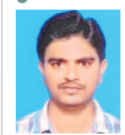
వెంకటేశ్వర్లు, తిరుమలగిరి డి.డి.

కలెక్టర్ కొట్టి కాయల నుంచి గింజలను వేరు చేయాలి. కందులను బూడిదతో కలిపి గానీ, వేపాకు కలిపి గానీ నిల్వ చేయాలి. నిల్వ చేసేటప్పుడు పురుగులు ఆశించకుండా ఉండేందుకు బాగా ఎండబెట్టాలి. ఇలాంటి చర్యలు తీసుకోవడం వల్ల కంది పంటలో ఆధిక దిగుబడి సాధించవచ్చు.