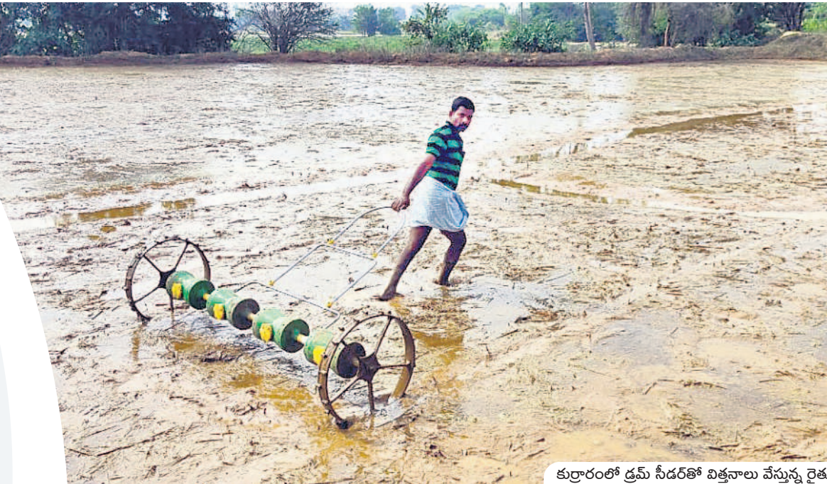
కుర్రారంలో డ్రమ్ సీడర్తో విత్తనాలు వేస్తున్న రైతు

నాలుగొండ్ల కింద చెక్క గానుగి నూనెల వ్యాపారం కోసం ఇక్కడకు వచ్చాం. అందులో అనుకున్న స్థాయిలో లాభాలు రాలేదు. మూడేండ్లు అదే కొనసాగించాం. లాభాలు అంతంతమాత్రమే ఉండడంతో కొత్తిమీర సాగుపై దృష్టి సారించాం. రెండే కరాలు లీజుకు తీసుకొని కొత్తిమీర సాగు చేశాం. ప్రతిసారి దున్నకానికి, విత్తనాలకు, ఎరువులు, కొన్ని డ్రీప్ సైస్టంలు మార్కెట్లోపాటు ఇతర ఖర్చులకు రూ.15వేల వరకు అవుతుంది. కొత్తిమీర పంట చేతికొచ్చాక రోజూ రూ.1500 వరకు వస్తుంది. ఖర్చులు పోనీ నెలకు రూ.30వేలు మిగులుతుంది. మార్కెట్కు, కరెంటుకు ఏ ఇబ్బంది లేదు. కూరగాయల వ్యాపారులు పొలం దగ్గరికి కూడా వచ్చి కొనుగోలు చేస్తారు. పండుగలు, పెండ్లిళ్ల సమయంలో హైదరాబాద్ నుంచి వస్తారు. రోజూ చేతినిండా పని దొరుకుతుంది. మా ఇద్దరికీ కూలి పడుతుంది.