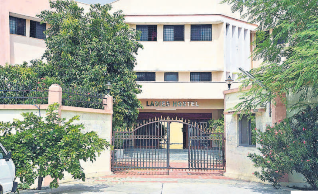
ఎంజీయూలోని లేడీస్ హాస్టల్