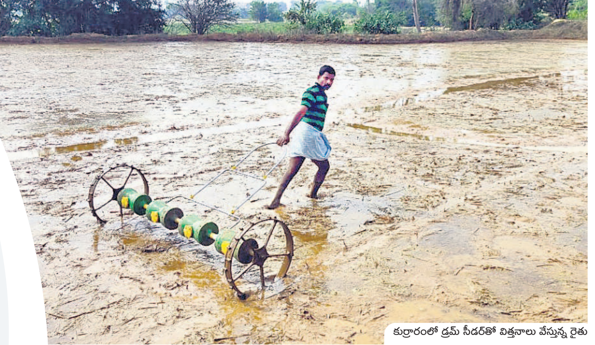
కుర్రారంలో డ్రమ్ సీడర్తో విత్తనాలు వేస్తున్న రైతు