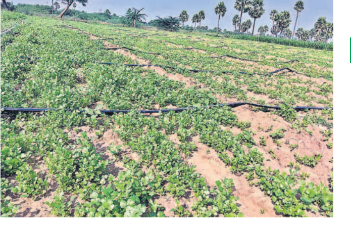
కొత్తిమీరతో మంచి ఆదాయం వస్తున్నది