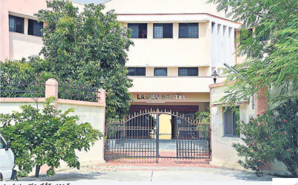
ఎంజీయూలోని లేడీస్ హాస్టల్