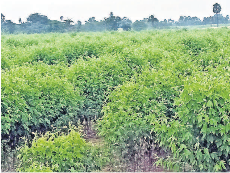
తిరుమలగిరి మండల కేంద్రంలో సాగు చేసిన కంది చేను