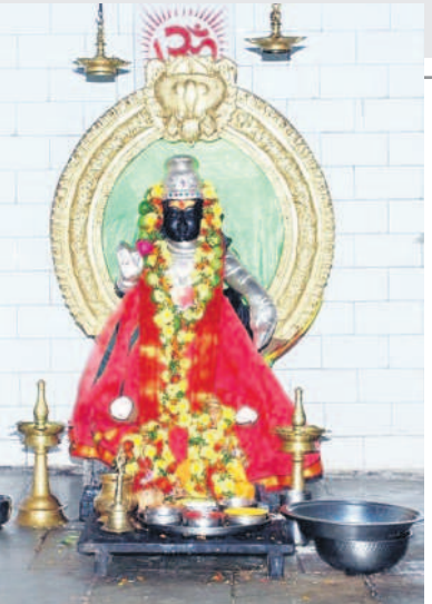
ఆలయంలో కొలువైన అయ్యప్పస్వామి విగ్రహం