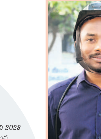
వనమి, జనరల్ మజ్దార్

బిల్లులు మాఫీ చేసి.. సంస్థ అధికారులతో సమానంగా మనకు ఏసీ బిల్ కూడా ఇస్తున్నరు. కార్మికులు సర్పిపోతే రూ.25 లక్షల మ్యాచింగ్ గ్రాంట్ ఇస్తున్నరు. కోటిడియారోనే ఎక్కడా లేని సంక్షేమం సింగరేణి కార్మికులకు అందిస్తున్న గొప్ప రాష్ట్రం ఒక్క తెలంగాణనే.. గివన్నీ రాష్ట్రంలో బీఆర్ఎస్ ఉండబట్టిగనే అయినయే. నేనైతే బీఆర్ఎస్ అనుబంధ కార్మిక సంఘం (టిబీజీఎస్) టీటు గుడ్లతా.. కుల్లంకల్లా చెప్పతున్నా. ప్లీట్ టైం అయితాంది. ఇగ బాయిలకు పోడమే పాండ్రే..