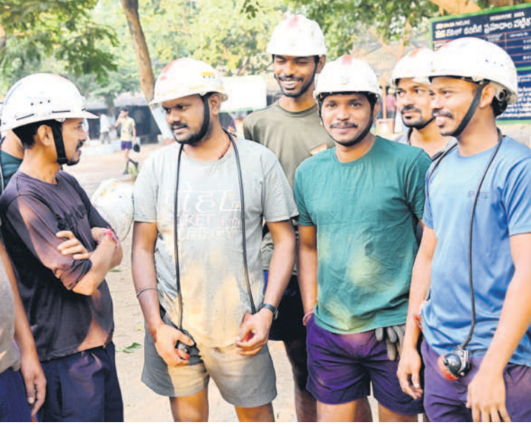
ముచ్చటించుకుంటున్న సింగరేణి కార్మికులు

నేను ఇల్లు కట్టుకుంటున్నా టైమ్ కు నాకు రూ. 10 లక్షల వడ్డీ లేని రుణం ఇచ్చిండ్రు తప్పి.. దానితోనే నేను తొందర ఇండ్లు కట్టుకోగలిగిన. రుణం బ్యాంక్ వాళ్ల మంజూరు చేస్తే యాజమాన్యమే దానికే సంవత్సరానికి రూ. 50వేల వడ్డీ మాఫీ చేసుకుంటు పోతున్నది. నా ఇల్లు నిలబడింది. ఇన్నీ రోజులు కంపెనీ క్వార్టర్ లో ఉన్నా.. ఇప్పుడు కంపెనీ సాయం తీసుకొని సొంతిల్లు కట్టుకున్నా.. కేసీఆర్ శ్రీరాంపూర్ ప్రగతి స్టేడియంల సభ పెట్టి వడ్డీ లేని పైనులు ఇస్తూ అనంగిన ఇళ్ల కట్టాలనే ఆలోచన వచ్చింది. ఇదే పది లక్షలు బయట తెస్తే నెలకు రూ. 20వేల మిల్లి అయ్యేటిది. ఇప్పుడా గోసంతా తప్పింది కదా.. ఇంతకుముందు దిగిపోయిన చాలా మంది కార్మికులు అప్పట్లో గి స్వీమ్ లేక ఇల్లు కట్టుకోలేక పోయిరు. వాళ్ల ఇప్పుడు ఎంత గోస పడుతున్నారో మనం నూత్తున్నం కదా.. నాకు మల్లె సొంతిల్లు కావాలనుకునేటోళ్లకు ఇది సానా ఉపయోగపడేది. తప్పి.. మీరందరూ యువకులు కొలువు జేస్తున్నప్పుడే ఇండ్లు కట్టుకోండి. వడ్డీ మాఫీని ఉపయోగించుకోండి.