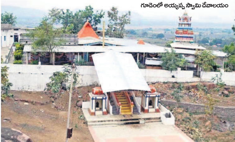
గూడెంలో అయ్యప్ప స్వామి దేవాలయం