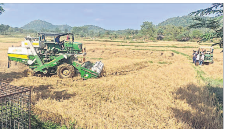
వరి పంట కోస్తున్న హార్వెస్టర్

దస్తరాబాద్, డిసెంబర్ 9 : కడెం ప్రాజెక్ట్ ఆయకట్టు కింద, బోర్లు, బావుల ద్వారా రైతులు వాసకాలం వరి పంటను సాగు చేశారు. పంటల చేతికి రావడంతో మండలంలో రైతులు తమ తమ పంటల్లో సాగు చేసిన వరి పంట కోతను ప్రారంభించారు. కాగా ప్రస్తుతం వరి కోత పనులు ముమ్మరంగా సాగుతున్నాయి. రైతులు హార్వెస్టర్ యంత్రాలను ఆశ్రయిస్తున్నారు. కాగా టైర్ల వరి కోత యంత్రానికి రూ. 1800 నుంచి రూ. 2000 వరకు, చైన్ వరి కోత యంత్రానికి రూ. 3200 నుంచి రూ. 3500 వరకు ధర ఉంది. పంటలు సమ్మద్ది పండడంతో రైతులు సంతోషం వ్యక్తం చేస్తున్నారు. సెకరించిన ధాన్యాన్ని ట్రాక్టర్ల ద్వారా తమ తమ ఇంటి వద్దకు, కొనుగోలు కేంద్రాలకు తరలిస్తున్నారు.