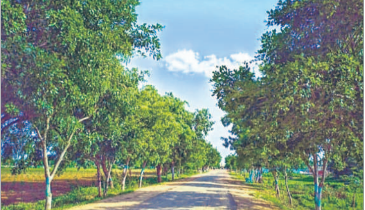
వాటోలి వెళ్లే మార్గంలో ఏపూగా పెరిగిన హరితహారం చెట్లు

బైంసాటాన్, డిసెంబర్, 9 : మండలంలోని వాటోలి గ్రామానికి వెళ్లే మార్గంలో హరిత హారంలో భాగంగా రోడ్డుకు ఇరువైపులా నాటిన మొక్కలు ఏపూగా పెరిగి చెట్లుగా మారి ఆహ్లాదాన్ని పంచుతున్నాయి. ఈ చెట్లు చల్లని నీడ స్వచ్ఛమైన గాలిని అందిస్తూ కనువిందు చేస్తున్నాయి.