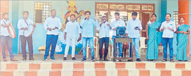
పరిశుభ్రతపై వివరిస్తున్న కళాకారులు