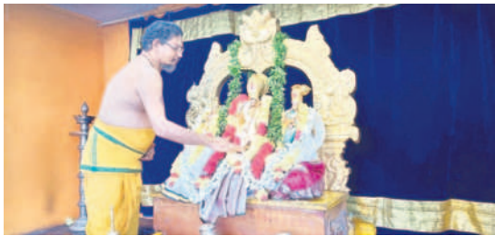
నిత్య కల్యాణం నిర్వహిస్తున్న అర్చకులు

భద్రాచలం, డిసెంబర్ 9: భద్రాచలం సీతారామచంద్రస్వామి దేవస్థానం అంతరాలయంలోని మూలవరులకు అర్చకులు శనివారం స్వర్ణ తులసి పూజలు చేశారు. నిత్య కల్యాణ మూర్తులకు బేడా మండపంలో శాస్త్రోక్తంగా నిత్య కల్యాణం నిర్వహించారు. భక్తులకు ప్రసాదాలు, శేష వస్త్రాలను అందజేశారు.