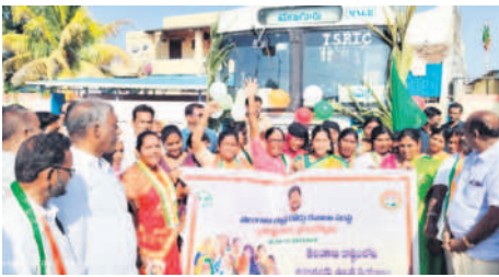
హార్షం వ్యక్తం చేస్తున్న మహిళలు