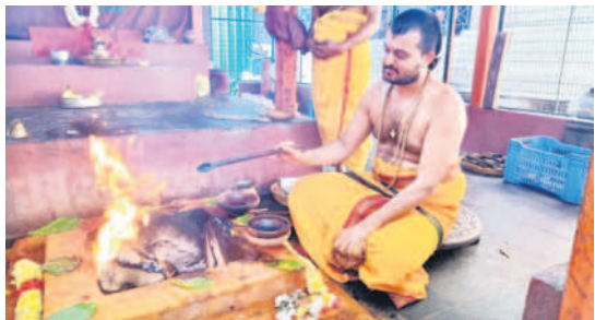
సుదర్శన హోమం నిర్వహిస్తున్న అర్చకులు

భద్రాచలం, డిసెంబర్ 9: భద్రాచలం సీతారామచంద్రస్వామి దేవస్థానంలోని యాగశాలలో అర్చకులు శనివారం సుదర్శన హోమం నిర్వహించారు. ముందుగా విష్ణుకృష్ణ ఆరాధన, కర్పణ పుణ్యాహవాచనం జరిపారు. అగ్ని ప్రతిష్ఠ, హోమం, ప్రసాద నివేదన జరిపారు. సుదర్శన కవచం, సుదర్శన జపం తదితర కార్యక్రమాలు నిర్వహించారు. పూర్ణాహుతి జరిపారు.