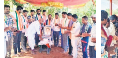
గుండాల, కరకగూడెంలో కేక కట్టే చేస్తున్న కాంగ్రెస్ నాయకులు

గుండాల, డిసెంబర్ 9: కాంగ్రెస్ అగ్ర నేత సోనియా గాంధీ జన్మదిన వేడుకలను కాంగ్రెస్ నాయకులు శనివారం నిర్వహించారు. కేక కట్టే చేశారు. ముత్తయ్య, కొబెం