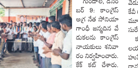
గుండాల, కరకగూడెంలో కేక కట్టే చేస్తున్న కాంగ్రెస్ నాయకులు

గుండాల, డిసెంబర్ 9: కాంగ్రెస్ అగ్ర నేత సోనియా గాంధీ జన్మదిన వేడుకలను కాంగ్రెస్ నాయకులు శనివారం నిర్వహించారు. కేక కట్టే చేశారు. ముత్తయ్య, కొబెం