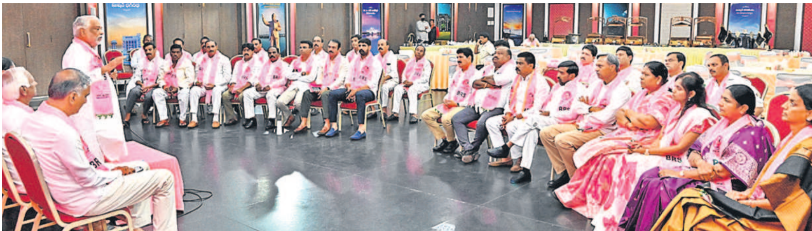
తెలంగాణ భవన్లో నిర్వహించిన బీఆర్ఎస్ ఎల్సీ సమావేశంలో మాట్లాడుతున్న బీఆర్ఎస్ పార్టీ సెక్రటరీ జనరల్ కే శంకర్. చిత్రంలో ఎమ్మెల్యేలు హాజరైతారు.