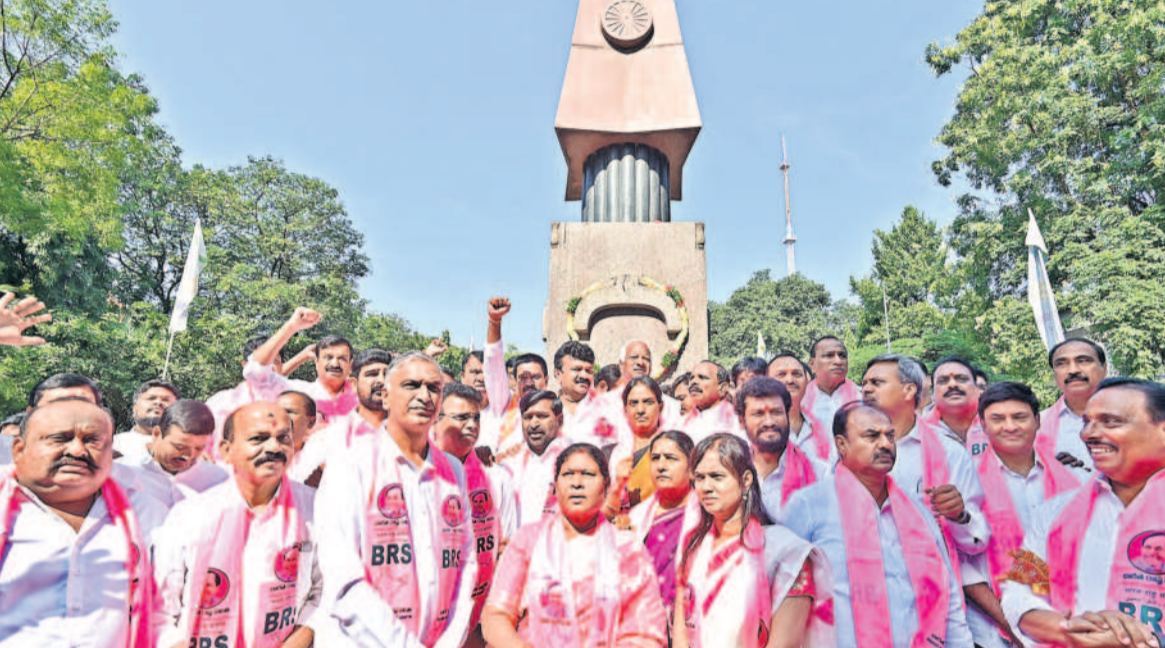
శనివారం గవర్నర్‌లోని అమరవీరుల స్మారక వద్ద నివాళులర్పించి, జై తెలంగాణ నినాదాలు చేస్తున్న బీఆర్ఎస్ ఎమ్మెల్యేలు