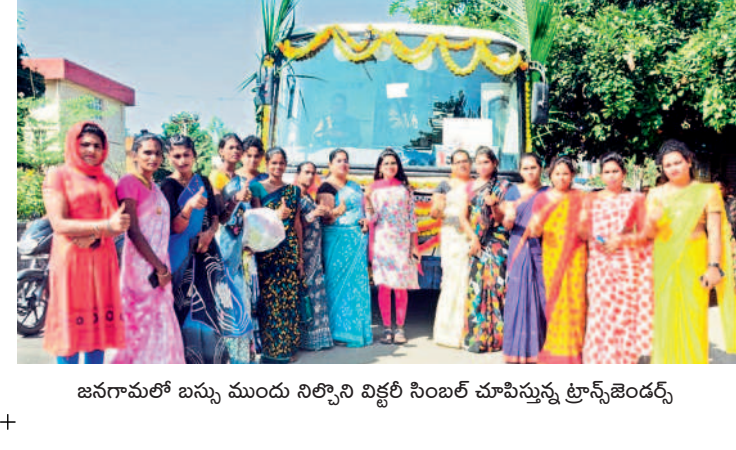
జనగామలో బస్సు ముందు నిల్వని విక్రీరి సింబల్ చూపిస్తున్న ట్రాన్స్ జెండర్స్