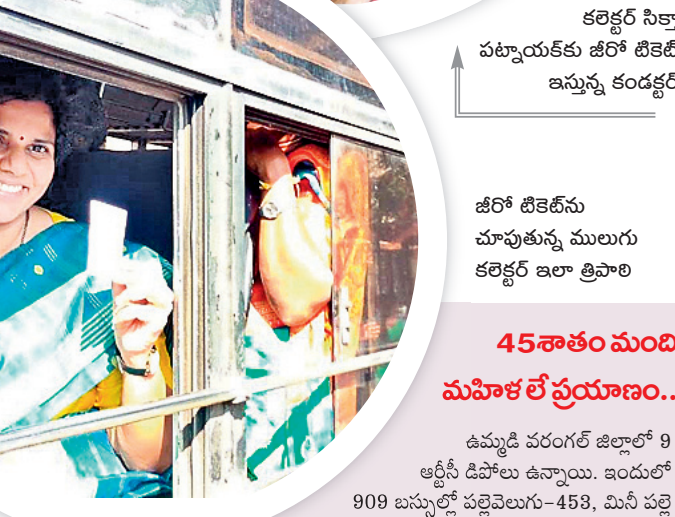
జీరో టికెట్లను చూపుతున్న ములుగు కలెక్టర్ ఇలా శ్రీవారి

45శాతం మంది మహిళలే ప్రయాణం.. ఉమ్మడి వరంగల్ జిల్లాలో 9 ఆర్టీసీ డిపోలు ఉన్నాయి. ఇందులో 909 బస్సుల్లో పల్లెవెలుగు-453, మినీ పల్లె వెలుగు-13, సీట్ ఆర్గెన్-57, ఎక్స్ ప్రెస్-123, ఇతర బస్సులు-263 ఉండగా ప్రతిరోజూ సుమారు 3 లక్షల కిలోమీటర్ల వరకు ఆయా డిపోల పరిధిలో తిరుగుతుండగా ప్రతిరోజూ ఆర్టీసీ కస్టమర్ల కోటిన్నర వరకు ఆదాయం వస్తున్నట్లు ఆధికారులు గణాంకాలు చెబుతున్నారు. నిత్యం 2.80లక్షల మంది ప్రయాణిస్తుండగా అందులో 45శాతం మహిళలే ఉన్నారు. సుమారు 1.26 లక్షల మంది బాలికలు, మహిళలు ప్రయాణిస్తున్నారు. ఇందులో పల్లెవెలుగు, ఆర్గెన్, ఎక్స్ ప్రెస్ ప్రయాణించే మహిళలు సుమారు 95వేల మంది ఉంటారు. వీరి ద్వారా రోజుకు రూ.47 లక్షల వరకు ఆదాయం ఆర్టీసీకి లభిస్తుంది. ఇక నుంచి ఈ మొత్తం మహిళా ప్రయాణికులకు మిగులుతుంది. వరంగల్ రీజియన్ పరిధిలో రోజుకు సగటున రూ.1.40కోట్ల ఆదాయం సమకూరుతుంది. ఉచిత ప్రయాణం వల్ల రోజుకు సుమారు రూ.47 లక్షల ఆదాయం ఆర్టీసీ కోల్పోనున్నది. ఈ మొత్తాన్ని రియంబర్స్ మెంట్ రూపంలో ప్రభుత్వం తిరిగి ఆర్టీసీకి చెల్లించనున్నది. ఉచిత ప్రయాణం వల్ల విద్యార్థినులు, యువకులు, మహిళల ఉద్యోగులు, మహిళా కూలీలకు మేలు కలుగుతుంది. జీరో టికెట్ వల్ల మహిళల బస్సు ప్రయాణాలు పెరిగి అవకాశం ఉన్నందున అవసరానికి సరిపడ బస్సులు విడుదల చేయాలని ప్రజలు కోరుతున్నారు.