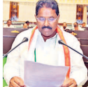
డొంకి మాధవరెడ్డి సర్పంచి ఎమ్మెల్యే