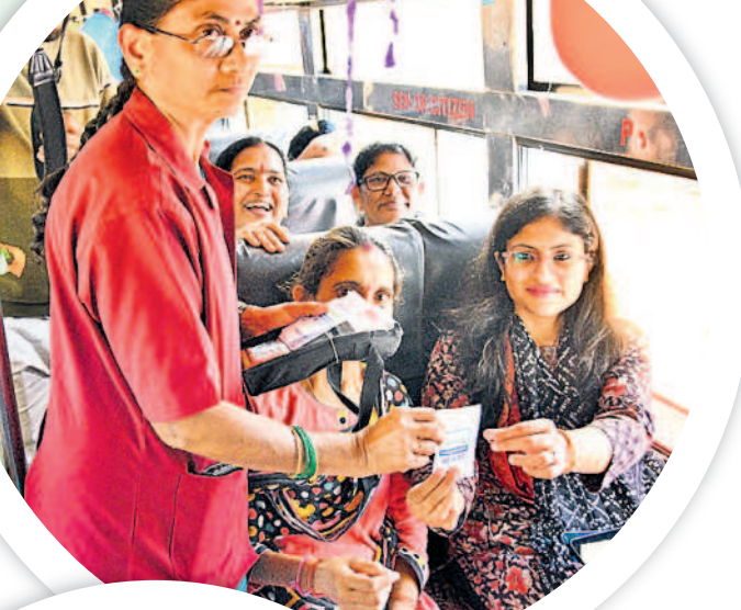
హనుమకొండ కలెక్టర్ సిక్తా పట్నాయక్ జీరో టికెట్ ఇస్తున్న కండక్టర్

కండక్టర్లకు సూచనలు.. ఈ పథకం అమలు చేసే.. తెలంగాణ వ్యాప్తంగా ఉన్న ఆర్టీసీ సిబ్బందికి ప్రత్యేకంగా కొన్నిటింగ్ ఇస్తున్నారు. ప్రయాణికుల రద్దీ వివరంగా పేర్కొంటే వల్ల తీసుకోవాలి జాగ్రత్తలను సూచించడంతో పాటు ఎలాంటి విసుగును ప్రదర్శించకుండా బాధ్యతతో వ్యవహరించాలని ఆర్టీసీ ఉద్యోగి