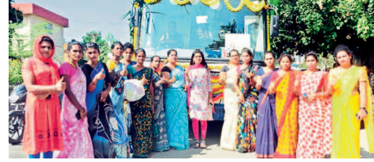
జనగామలో బస్సు ముందు నిల్వని విక్రీరి సింబల్ చూపిస్తున్న ట్రాన్స్ జెండర్స్

వేములవాడకు వెళ్తున్నా.. మాది స్టేషన్ ఫస్ట్ ఫ్లోర్. మేం అందరం కలిసి వేములవాడకు మొక్క చెల్లిండుకునేందుకు వెళ్తున్నాం. బస్సులో టికెట్ లేకుండా ట్రాగ్ వెళ్తున్నందుకు చాలా ఆనందంగా ఉంది. బస్సులో ఎక్కడికైనా టికెట్ లేకుండా వెళ్తుండు ప్రభుత్వం బాగా చేసింది. పైనలు కూడా మిగులుతాయి. - ఎన్.పుష్ప, ప్రయాణికురాలు