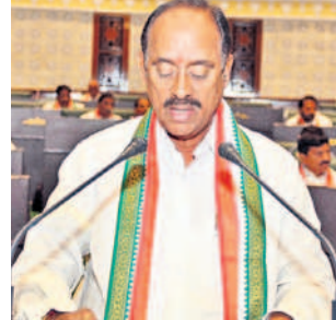
రేవంకొండ్రె శరణం ఉత్తరం ఎమ్మెల్యే