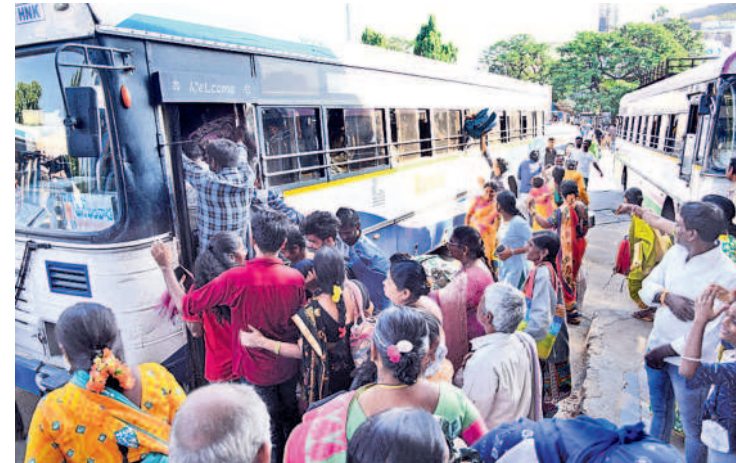
మహిళలతో కోలాహలంగా హనుమకొండ బస్ స్టేషన్