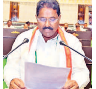
దొంతి మాధవరెడ్డి సర్పంచి ఎమ్మెల్యే