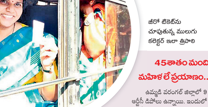
జీరో టికెట్ను చూపుతున్న ములుగు కలెక్టర్ ఇలా త్రిపాఠి

45శాతం మంది మహిళలే ప్రయాణం.. ఉమ్మడి వరంగల్ జిల్లాలో 9 ఆర్టీసీ డిపోలు ఉన్నాయి. ఇందులో 909 బస్సుల్లో పల్లెవెలుగు-453, మినీ పల్లె వెలుగు-13, సిటీ ఆర్టీసీ-57, ఎక్స్ ప్రెస్-123, ఇతర బస్సులు-263 ఉండగా ప్రతిరోజూ సుమారు 3 లక్షల కిలోమీటర్ల వరకు ఆయా డిపోల పరిధిలో తిరుగుతుండగా ప్రతిరోజూ ఆర్టీసీ సుమారు కోటిన్నర వరకు ఆదాయం వస్తున్నట్లు అధికారులు గణాంకాలు చెబుతున్నారు. నిత్యం 2.80లక్షల మంది ప్రయాణిస్తుండగా అందులో 45శాతం మహిళలే ఉన్నారు. సుమారు 1.26 లక్షల మంది బాలికలు, మహిళలు ప్రయాణిస్తున్నారు. ఇందులో పల్లెవెలుగు, ఆర్టీసీ, ఎక్స్ ప్రెస్ ప్రయాణించే మహిళలు సుమారు 95వేల మంది ఉంటారు. వీరి ద్వారా రోజుకు రూ.47 లక్షల వరకు ఆదాయం ఆర్టీసీకి లభిస్తుంది. ఇక నుంచి ఈ మొత్తం మహిళా ప్రయాణికులకు మిగులుతుంది. వరంగల్ రిజియన్ పరిధిలో రోజుకు సగటున రూ.1.40కోట్ల ఆదాయం సమకూరుతుంది. ఉచిత ప్రయాణం వల్ల రోజుకు సుమారు రూ.47 లక్షల ఆదాయం ఆర్టీసీ కోల్పోనున్నది. ఈ మొత్తాన్ని రియంబర్స్ మెంట్ రూపంలో ప్రభుత్వం తిరిగి ఆర్టీసీకి చెల్లించనున్నది. ఉచిత ప్రయాణం వల్ల విద్యార్థినులు, యువకులు, మహిళల ఉద్యోగులు, మహిళా కూలీలకు మేలు కలుగవచ్చుంది. జీరో టికెట్ వల్ల మహిళల బస్సు ప్రయాణాలు పెరిగి అవకాశం ఉన్నందున అవసరానికి సరిపడ బస్సులు విడుదల చేయాలని ప్రజలు కోరుతున్నారు.