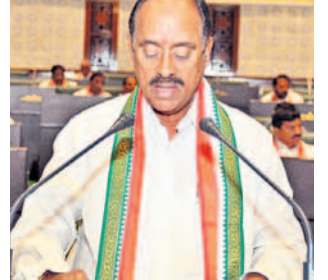
రేవంకెరెడ్డి పరకాల ఎమ్మెల్యే