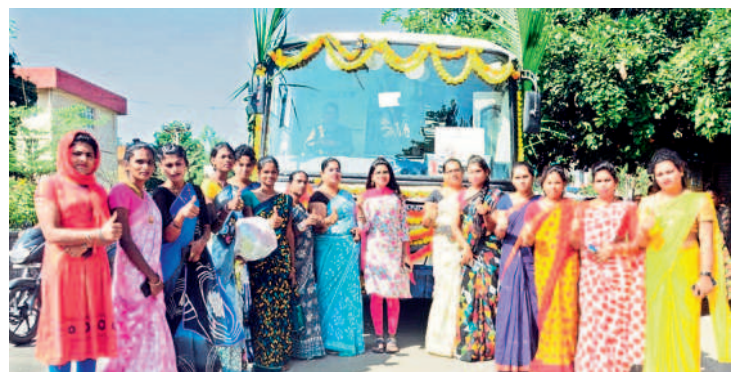
జనగామలో బస్సు ముందు నిల్వని విక్రీరి సింబల్ చూపిస్తున్న ట్రాన్స్ జెండర్స్