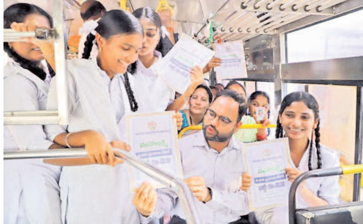
బాలికలతో మామబాబాద్ కలెక్టర్ శశాంక