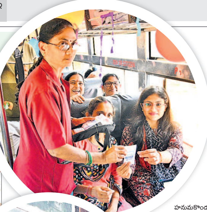
హనుమకొండ కలెక్టర్ సిక్తా పట్నాయక్ జీరో టికెట్ ఇస్తున్న కండక్టర్

ఈ పథకం అమలు చేసే.. తెలంగాణ వ్యాప్తంగా ఉన్న ఆర్టీసీ సిబ్బందికి ప్రత్యేకంగా కొన్ని నిబంధనలు ఉన్నాయి. ప్రయాణికుల రద్దీ వివరాలను తెలియజేసే జాగ్రత్తలను సూచించడంతో పాటు ఎలాంటి విసుగును ప్రదర్శించకుండా బాధ్యతతో వ్యవహరించాలని ఆర్టీసీ ఉద్యోగినులకు హితబోధ చేశారు.