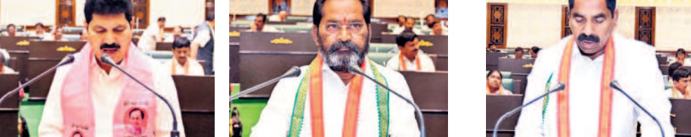
మురళీనాయక్ మామబాబాద్ ఎమ్మెల్యే