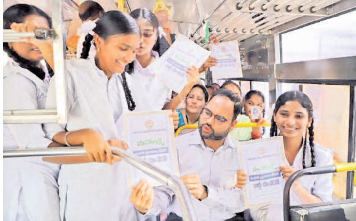
బాలికలతో మామబాబాద్ కలెక్టర్ శశాంక