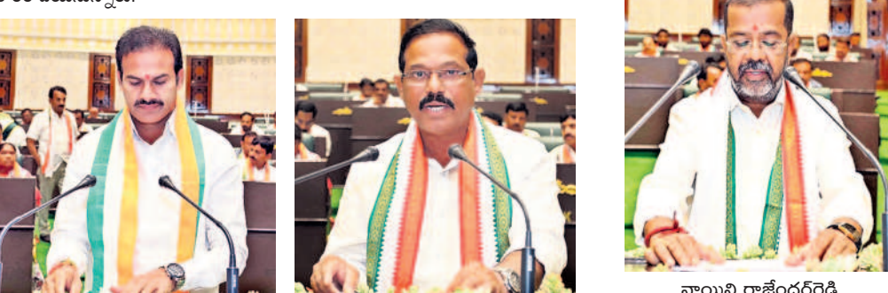
రాంచంద్ర నాయక్ దొర్నకల్ ఎమ్మెల్యే