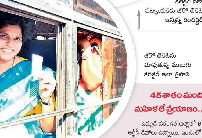
జీరో టికెట్ను చూపుతున్న ములుగు కలెక్టర్ ఇలా త్రిపాఠి