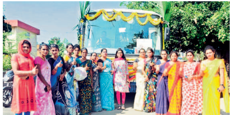
జనగామలో బస్సు ముందు నిల్వని విక్రీ సింబల్ చూపిస్తున్న ట్రాన్స్ జెండర్స్