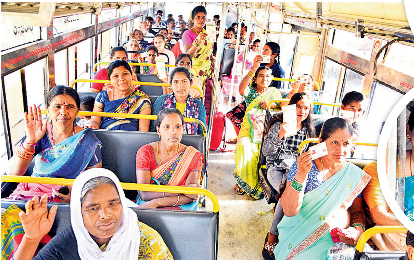
హనుమకొండలో ఆర్టీసీ బస్సులో ఉచితంగా ప్రయాణం చేస్తూ ఆధారకార్లు చూపిస్తున్న మహిళలు