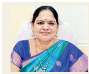
మహిళలు ఉచిత ప్రయాణాన్ని ఉపయోగించుకోవాలి..