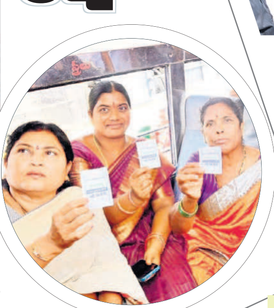
నాగర్ కర్నూల్ లో ఉచిత ప్రయాణ టికెట్ చూపిస్తున్న మహిళలు