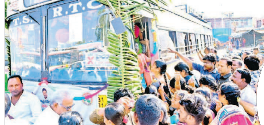
నాగర్ కర్నూల్ లో బస్సు ఎక్కేందుకు పోటీ పడుతున్న మహిళలు