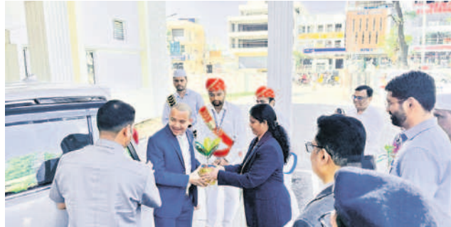
హైకోర్టు జడ్జి లక్ష్మీనారాయణకు మొక్కను అందిస్తున్న జిల్లా కోర్టు న్యాయమూర్తి శ్రీదేవి