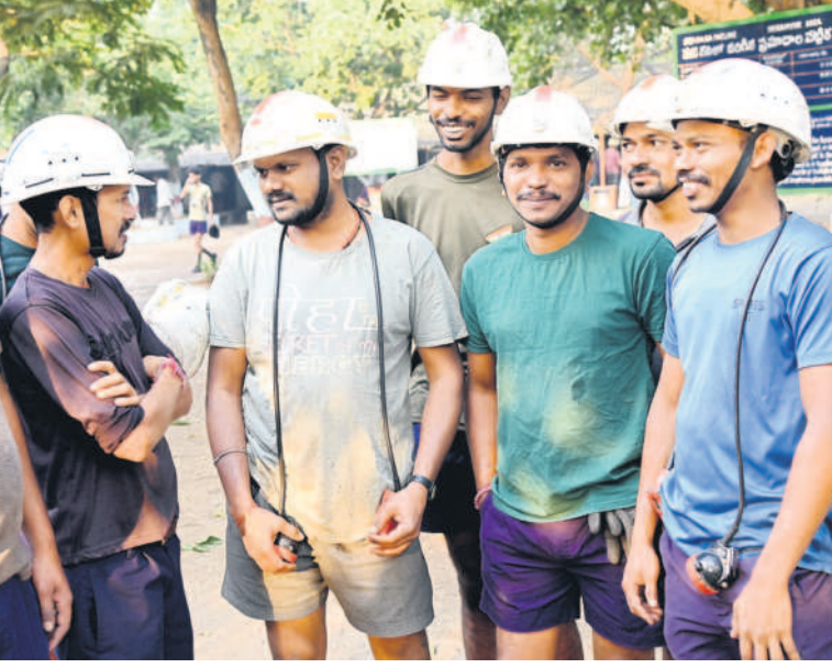
ముచ్చటించుకుంటున్న సింగరేణి కార్మికులు