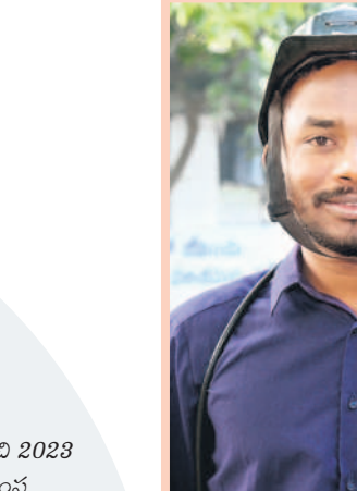
వనవీ, జనరల్ మజ్దార్

అబ్బి ఏం చెప్పినవో కుమారు.. ఎన్ని జేసిండ్లు మన కోసం. గీ ప్రభుత్వంలో ఎవ్వలు ఊహించనివి కూడా చేసి చూపిచ్చిండ్లు. అంటే డర్లర్ జయంతి, క్రిస్మస్, రంజాన్, సంకాంతికి పీహెచ్డీ (పియ్ డి హెచ్ డి) ఇస్తున్నరు. తెలంగాణ వచ్చినంత 2014 వరకు కంపెనీ రోడ్లలో ఉన్న ప్రతి కార్మికుడికీ తెలంగాణ ఇంక్రిమెంట్ ఇచ్చిండ్లు.. తెలంగాణ కంటే ముందే ప్రత్యేక రాష్ట్రాలు ఎన్నో ఏర్పడినయ్యే. కానీ.. అక్కడున్న బొగ్గు గనుల్లో వాళ్లు ఏం చేయలే.. మనకైతే ఇంక్రిమెంట్ వేసిండ్లు. 2011లో సకల జనుల సమ్మె చేసినయ్యే.. 45 రోజులు చలుగు, పార వక్కన పెట్టి కొట్లాడినయ్యే.. గా సమ్మె వీరియడేకు కూడా జీతం ఇచ్చుడు ఒక మిలీకరీ తెలుసా.. ఒకప్పుడు కార్మికులకు, వాళ్ల పిల్లలకు మాత్రమే కార్మికోట్ వైద్య సదుపాయం ఉండే. ఇప్పుడు తల్లిదండ్రులకు కూడా వేర్పిండ్లు. కఠింట్ బిల్లులు మాఫీ చేసి.. సంస్థ అధికారులతో సమానంగా మనకు ఏసీ బిల్ కూడా ఇస్తున్నరు. కార్మికులు సర్పిపోతే రూ.25 లక్షల మ్యూచింగ్ గ్రాంట్ ఇస్తున్నరు. కోటిడియారోనే ఎక్కడా లేని సంక్షేమం సింగరేణి కార్మికులకు అందిస్తున్న గప్ప రాష్ట్రం ఒక్క తెలంగాణనే.. గివన్న రాష్ట్రంలో బీఆర్ఎస్ ఉండబట్టిగనే అయినయ్యే. నేనైతే బీఆర్ఎస్ అనుబంధ కార్మిక సంఘం (టిబీజీకేఎస్) ఓటు గుద్దుతా.. కుల్లంకల్లా చెప్పతున్నా. ప్లీట్ టైం అయితాంది. ఇగ బాయిలకు పోదమే పాండ్రే..