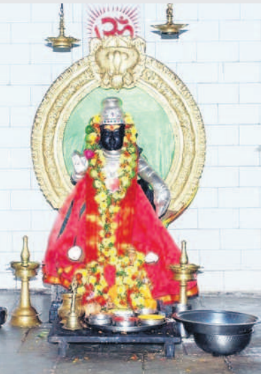
ఆలయంలో కొలువైన అయ్యప్పస్వామి విగ్రహం