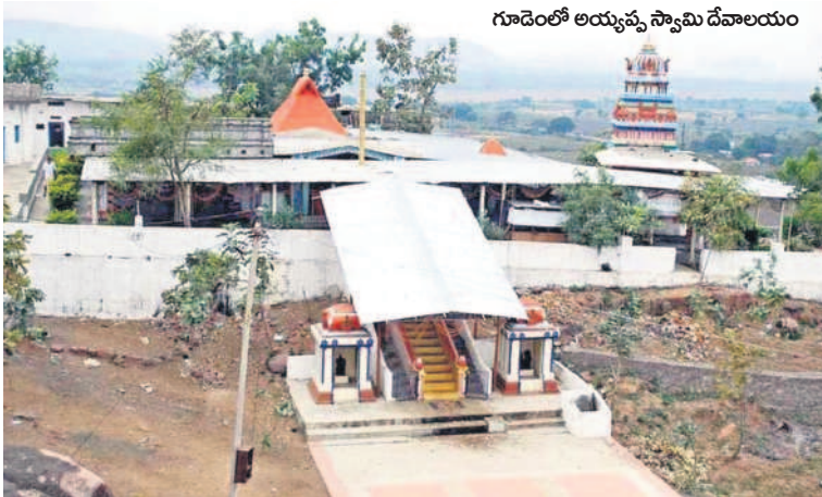
గూడెంలో అయ్యప్ప స్వామి దేవాలయం