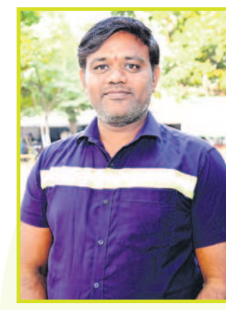
దాని సదయ్య, ట్రామర్

బిల్లులు మాఫీ చేసి.. సంస్థ అధికారులతో సమానంగా మనకు ఏసీ బిల్ కూడా ఇస్తున్నరు. కార్మికులు సర్పిపోతే రూ.25 లక్షల మ్యూచింగ్ గ్రాంట్ ఇస్తున్నరు. కోటిడియారోనే ఎక్కడా లేని సంక్షేమం సింగరేణి కార్మికులకు అందిస్తున్న గప్ప రాష్ట్రం ఒక్క తెలంగాణనే.. గివన్న రాష్ట్రంలో బీఆర్ఎస్ ఉండబట్టిగనే అయినయ్యే. నేనైతే బీఆర్ఎస్ అనుబంధ కార్మిక సంఘం (టిబీజీకేఎస్) ఓటు గుద్దుతా.. కుల్లంకల్లా చెప్పతున్నా. ప్లీట్ టైం అయితాంది. ఇగ బాయిలకు పోదమే పాండ్రే..