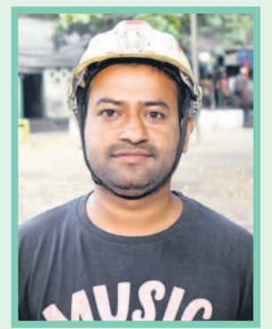
షిరాజీపాషా, జనరల్ మజ్దార్

అసీ నర్సంగ్ కాక.. లాభాల వాటా ఇచ్చుడు ఒక్కటేనాన.. కారుణ్య నియామకం ఇచ్చి నా బతుకును నిలబెట్టింది.. మా నాయన రిటైర్మెంట్ అయినంత ఆ నోకరి నాకు రాదని బాధపడిన. గప్పటికే కాంగ్రెసోళ్లు కారుణ్య నియామకాలను తీసేసి 24 ఏండ్లు అయితుండే. నాకు రావాల్సిన నాన్న ఉద్యోగం ఆగిపోయి ఆఖరికి నేను డైవర్ పనిలో చేరిన. తెలంగాణ వచ్చినంత 2016లో దరఖాస్తులు పెట్టుకోవచ్చున్నరు. గప్పుడు అప్పయ్ చేస్తే 2020లో నాన్న వాదనక్కో ఉద్యోగం నాకు వచ్చింది. ఎప్పుడో పదేళ్ల క్రితం రావాల్సిన నోకరి నాకు 30 ఏండ్ల వయసు వచ్చినంత వచ్చే. కేసీఆర్ చలువతోనే నేను మా కుటుంబం సంతోషంగా బతుకుతున్నాం. తెలంగాణ ప్రభుత్వం వచ్చినంత గీ నిర్ణయం తీసుకోకుంటే నాకు సింగరేణి నోకరి వచ్చేది కాదు. సింగరేణిలో 12,500 మందికి కారుణ్య నియామకాలు ఇచ్చి. 2015 వరకు పెండింగ్లో ఉన్న 3,500 మందికి ఉద్యోగాలు కల్పించిన ఘనత తెలంగాణ సర్కారేకే దక్కుతది.