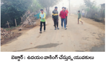
బెజ్జూర్ : ఉదయం వాకింగ్ చేస్తున్న యువకులు