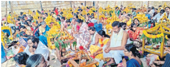
సామూహిక సత్యనారాయణస్వామి వ్రతాలు ఆచరిస్తున్న భక్తులు

దండేపల్లి, డిసెంబర్ 9 : కార్తీక బహుళ ద్వాదశి సందర్భంగా దండేపల్లి మండలం గూడెం రమాసహిత సత్యనారాయణ స్వామి ఆలయంలో శనివారం భక్తుల తాకిడి నెలకొంది. పెద్ద సంఖ్యలో తరలిరావడంతో సందడిగా మారింది. ముందుగా భక్తులు గోదావరిలో పుణ్యస్నానాలు చేసి, కార్తీక దీపాలు వదిలారు. గంగమ్మకు పూజలు నిర్వహించారు. అనంతరం గుట్ట కింద రావి చెట్టు వద్ద, గుట్టపైన ధ్వజ స్తంభం వద్ద మహిళలు కార్తీక దీపాలు వెలిగించారు. అనంతరం స్వామి వారిని దర్శించుకొని తీర్థప్రసాదాలు స్వీకరించారు.