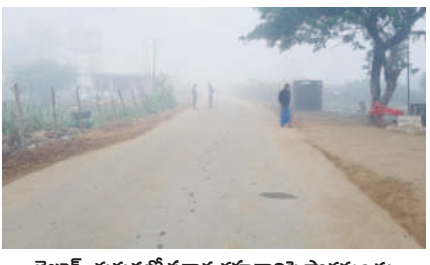
బెజ్జూర్ : కుకుడలో ప్రధాన రహదారిపై పొగమంచు

■ మిగ్ జాం తుఫాను ప్రభావం ■ పెరిగిన చలి తీవ్రత ■ ఉదయం 9 గంటల వరకు దట్టమైన పొగమంచు మిగ్ జాం తుఫాను ప్రభావంతో పల్లెలు, పట్టణాలపై పొగ మంచు కమ్ముకున్నది. ఉదయం 9 గంటల వరకు కూడా వీడకుండా దుప్పటిలా కప్పేస్తున్నది. హెడ్ లైట్లు వేయనిదే రోడ్డుపై వాహనాలు నడుపలేని పరిస్థితి నెలకొన్నది. నాలుగు రోజులుగా పగటి ఉష్ణోగ్రతలు పడిపోవడం, రాత్రి ఉష్ణోగ్రతలు సాధారణం కంటే తక్కువ నమోదవుతుండడంతో చలి తీవ్రత కూడా పెరిగింది. దీనికి తోడు శీతల పవనాలతో మరింత వణుకు పుడుతున్నది. మరోవైపు రోజంతా ఈదురు గాలులు వీస్తుండడంతో ప్రజానీకం బయటికి రావాలంటేనే జంతుతున్నది. సాయంత్రమైతే గజగజ వణుకుతున్నది. - ఆసిఫాబాద్ టౌన్/బెజ్జూర్, డిసెంబర్ 9