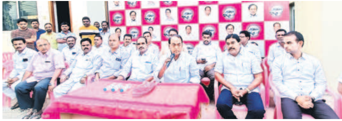
మాట్లాడుతున్న మాజీ మంత్రి అల్లీల ఇంద్రకరణ్ రెడ్డి