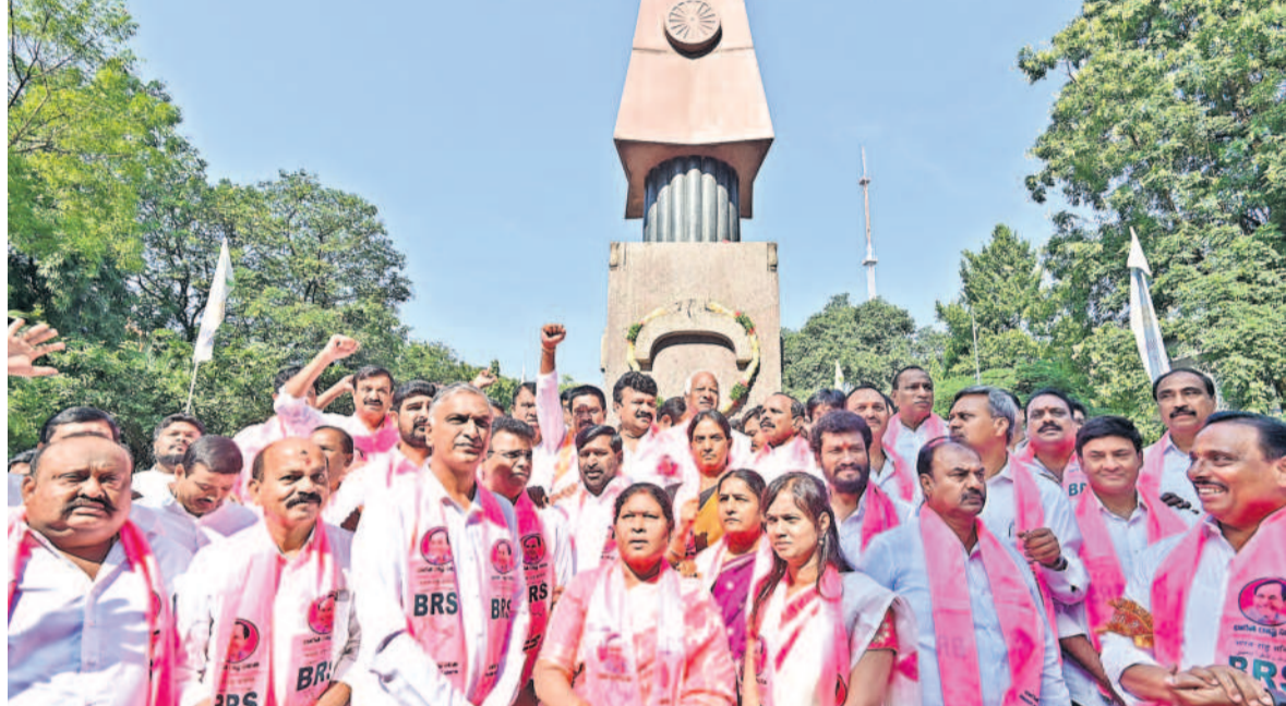
శనివారం గవర్నర్ లోన్ అమరవీరుల స్మారకం వద్ద నివాళులర్పించి, జై తెలంగాణ నినాదాలు చేస్తున్న బీఆర్ఎస్ ఎమ్మెల్యేలు

హాజరు కాలేకపోయిన కేసీఆర్, కేటీఆర్ తుంటి ఎముక మార్పిడి శస్త్రచికిత్స జరిగిన నేపథ్యంలో కేసీఆర్ శాసనసభాపక్షం ఛోటికి రాలేకపోయారు. ఆయనకు పరిచర్యలు చేస్తూ దవాఖానలోనే ఉండిపోయిన పార్టీ వర్కింగ్ ప్రెసిడెంట్ కేటీఆర్ కూడా ఎల్సీ సమావేశానికి హాజరు కాలేకపోయారు.