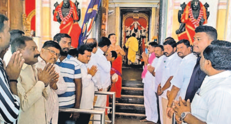
దుబ్బాక టౌన్: బాలాజీ దేవాలయంలో పూజలు చేస్తున్న ముస్లిం వైర్ వర్కర్ల వనిత, బీఆర్ఎస్ శ్రేణులు