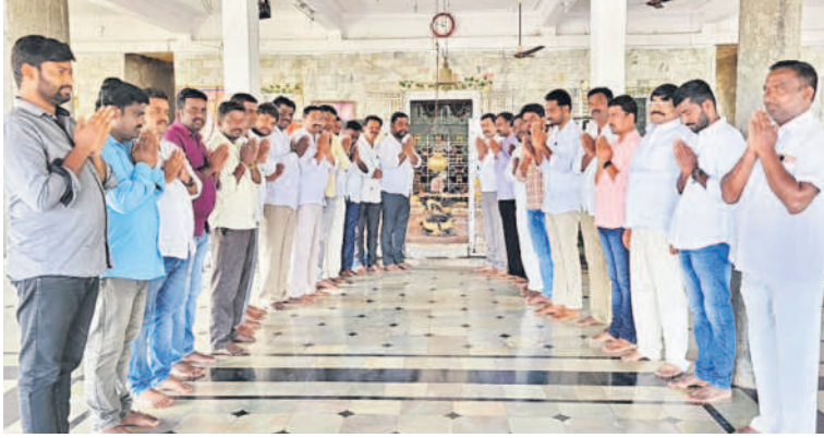
తొగుట మండలం రాంపూర్ స్వ.టిక లింగేశ్వరాలయంలో ప్రత్యేక పూజలు చేస్తున్న బీఆర్ఎస్ శ్రేణులు