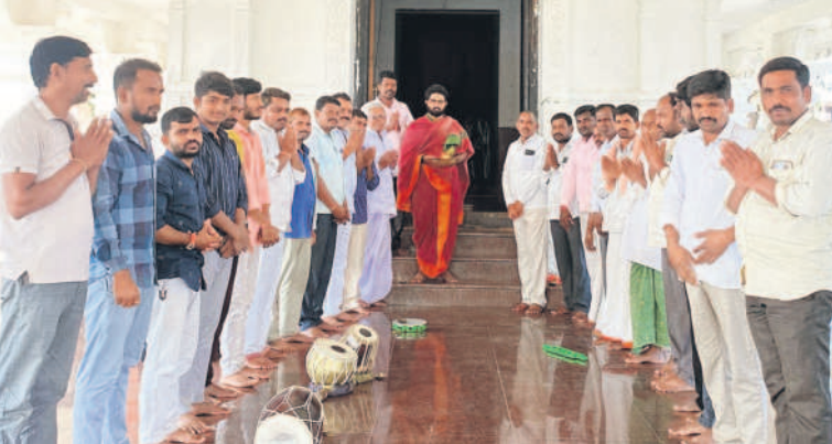
సిద్దిపేటరూరల్: చింతమడక పట్టాభిరాముడి ఆలయంలో పూజలు నిర్వహిస్తున్న సర్పంచ్, గ్రామస్థులు