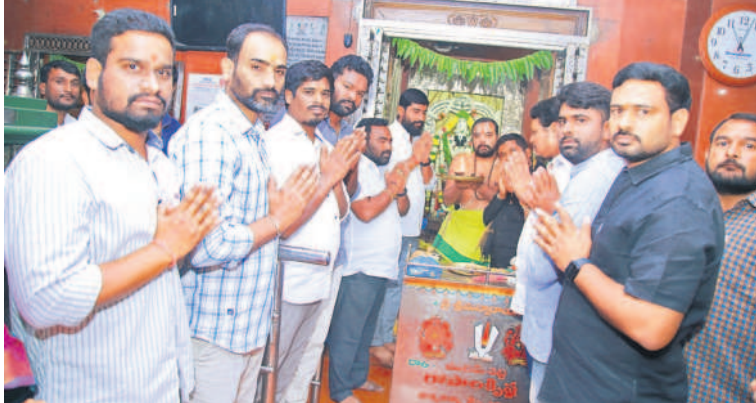
సిద్దిపేట వేంకటేశ్వరాలయంలో పూజలు చేస్తున్న బీఆర్ఎస్ యువజన, విద్యార్థి విభాగం నాయకులు