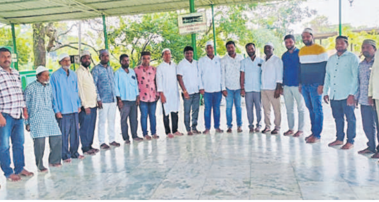
గజ్వేల్ లోని దర్గాలో ప్రార్థనలు చేస్తున్న ముస్లింలు