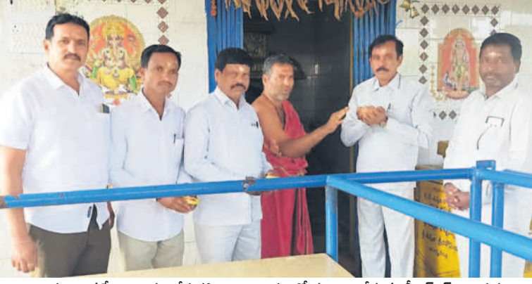
నారాయణరావుపేట: బుగ్గరాజేశ్వరస్వామి ఆలయంలో పూజలు చేస్తున్న బీఆర్ఎస్ నాయకులు