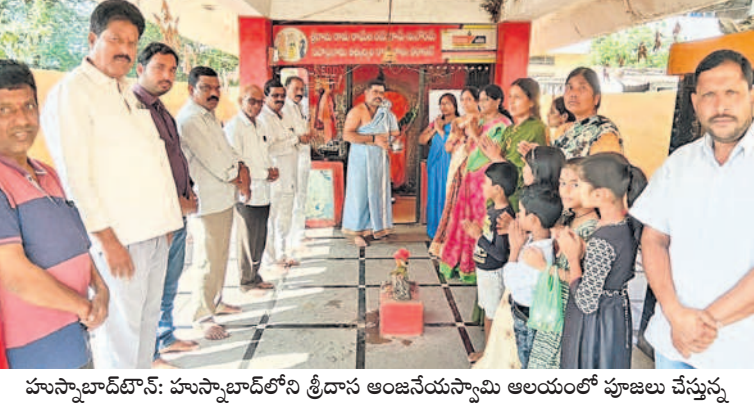
హుస్సూబాద్ టౌన్: హుస్సూబాద్ లోని శ్రీ దాస ఆంజనేయస్వామి ఆలయంలో పూజలు చేస్తున్న ముస్లిం వైర్ వర్కర్ల ఆటల రజితావెంకట తదితరులు