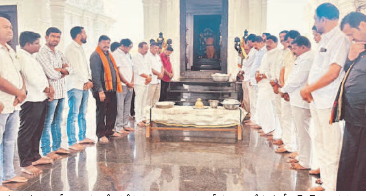
సంగనూరు: కోనాయపల్లి వేంకటేశ్వరస్వామి ఆలయంలో పూజలు చేస్తున్న బీఆర్ఎస్ నాయకులు