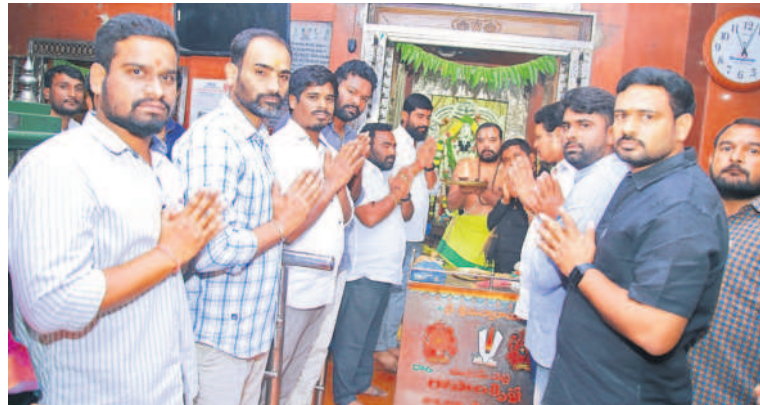
సిద్దిపేట వేంకటేశ్వరాలయంలో పూజలు చేస్తున్న బీఆర్ఎస్ యువజన, విద్యార్థి విభాగం నాయకులు