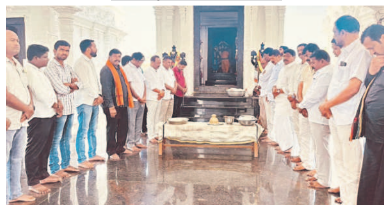
సంగనూరు: కోనాయపల్లి వేంకటేశ్వరస్వామి ఆలయంలో పూజలు చేస్తున్న బీఆర్ఎస్ నాయకులు