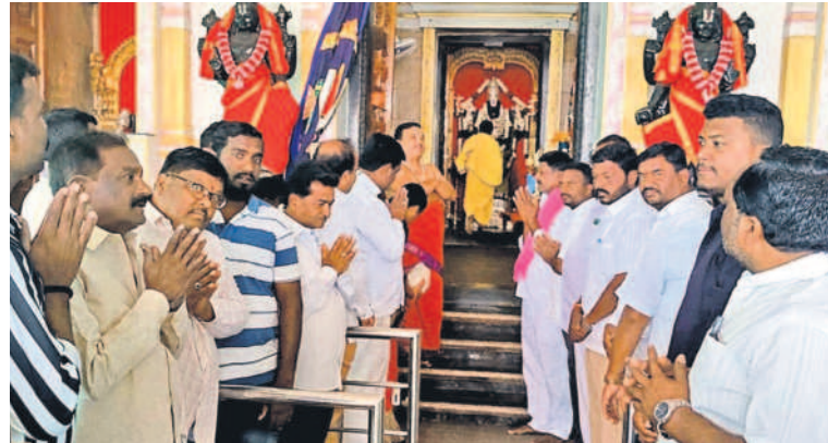
దుబ్బాక టౌన్: బాలాజీ దేవాలయంలో పూజలు చేస్తున్న మునిపల్లె చైర్మన్ వనిత, బీఆర్ఎస్ శ్రేణులు