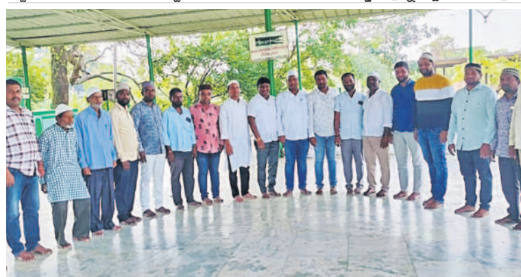
గజ్వేల్లోని దర్గాలో ప్రార్థనలు చేస్తున్న ముస్లింలు