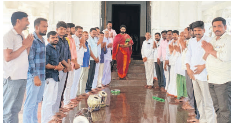
సిద్దిపేటరూరల్: చింతమడక పట్టాభిరాముడి ఆలయంలో పూజలు నిర్వహిస్తున్న సర్పంచ్, గ్రామస్థులు