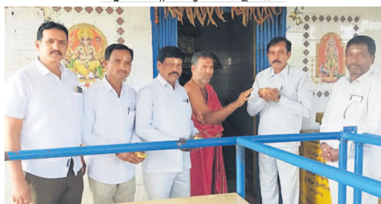
నారాయణరావుపేట: బుగ్గరాజేశ్వరస్వామి ఆలయంలో పూజలు చేస్తున్న బీఆర్ఎస్ నాయకులు