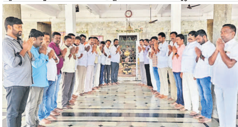
తోగుట మండలం రాంపూర్ స్పటిక లింగేశ్వరాలయంలో ప్రత్యేక పూజలు చేస్తున్న బీఆర్ఎస్ శ్రేణులు