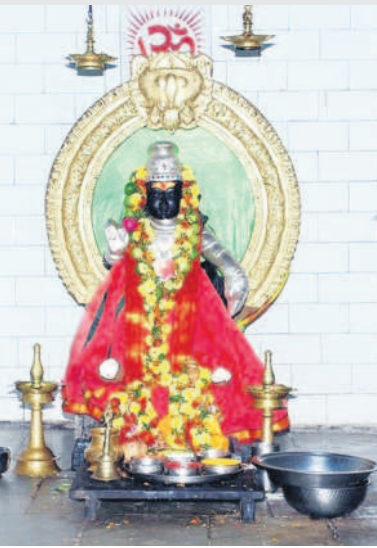
ఆలయంలో కొలువైన అయ్యప్పస్వామి విగ్రహం