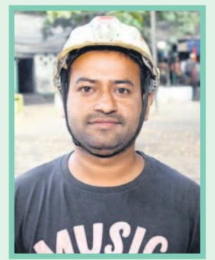
షిరాజీపాష, జనరల్ మజ్దార్

అసీ నర్సారీ కాక.. లాభాల వాటా ఇచ్చుడు ఒక్కటేనాన.. కారుణ్య నియామకం ఇచ్చి నా బతుకును నిలబెట్టిండ్రు.. మా నాయన రిటైర్మెంట్ అయినంత ఆ నోకరి నాకు రాదని బాధపడిన. గప్పటికే కాంగ్రెసోళ్లు కారుణ్య నియామకాలను తీసేసి 24 ఏండ్లు అయిండ్రు. నాకు రావాల్సిన నాన్న ఉద్యోగం ఆగిపోయి ఆఖరికి నేను డ్రైవర్ పనిలో చేరిన. తెలంగాణ వచ్చినంత 2016లో దరఖాస్తులు పెట్టుకోమ్మన్నరు. గప్పుడు అప్పయ్ చేస్తే 2020లో నాన్న వాదనక్కో ఉద్యోగం నాకు వచ్చింది. ఎప్పుడో పదేళ్ల క్రితం రావాల్సిన నోకరి నాకు 30 ఏండ్ల వయసు వచ్చినంత వచ్చే. కేసీఆర్ చలువతోనే నేను మా కుటుంబం సంతోషంగా బతుకుతున్నాం. తెలంగాణ ప్రభుత్వం వచ్చినంత గి నిర్ణయం తీసుకోకుంటే నాకు సింగరేణి నోకరి వచ్చేది కాదు. సింగరేణిలో 12,500 మందికి కారుణ్య నియామకాలు ఇచ్చి. 2015 వరకు పెండింగ్లో ఉన్న 3,500 మందికి ఉద్యోగాలు కల్పించిన ఘనత తెలంగాణ సర్కారేకే దక్కుతది.