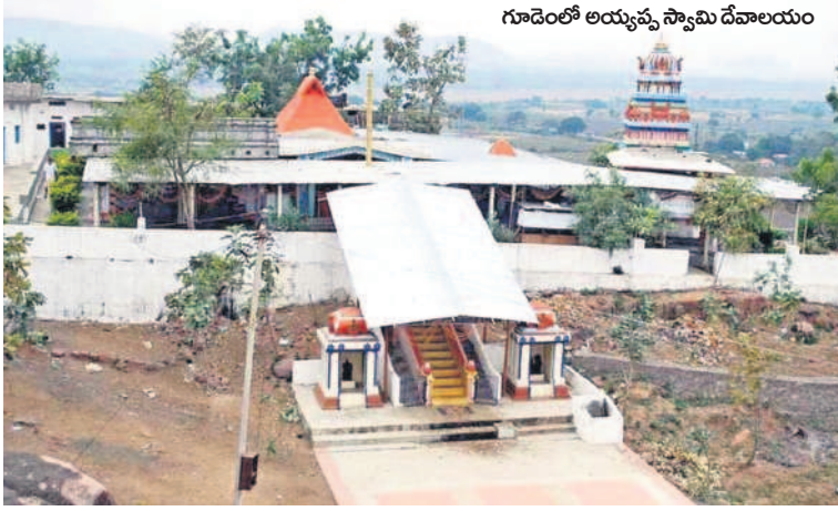
గూడెంలో అయ్యప్ప స్వామి దేవాలయం