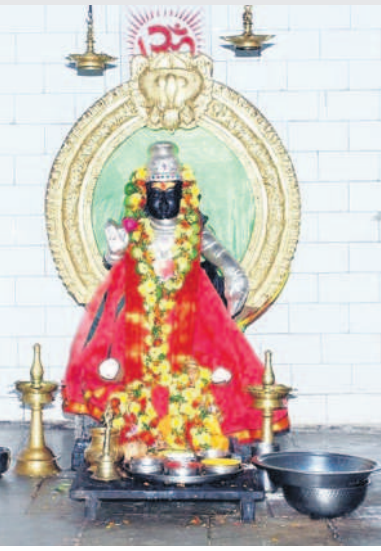
ఆలయంలో కొలువైన అయ్యప్పస్వామి విగ్రహం