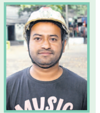
షిరాజీపాష, జనరల్ మజ్దార్

అసీ నర్సారావు.. లాభాల వాటా ఇచ్చుడు ఒక్కటేనానీ.. కారుణ్య నియామకం ఇచ్చి నా బతుకును నిలబెట్టిండ్లు.. మా నాయన రిటైర్మెంట్ అయినంత ఆ నోకరి నాకు రాదని బాధపడిన. గప్పటికే కాంగ్రెసోళ్లు కారుణ్య నియామకాలను తీసేసి 24 ఏండ్లు అయితుండే. నాకు రావాల్సిన నాన్న ఉద్యోగం ఆగిపోయి ఆఖరికి నేను డ్రైవర్ పనిలో చేరిన. తెలంగాణ వచ్చినంత 2016లో దరఖాస్తులు పెట్టుకోమ్మన్నరు. గప్పుడు అప్పయ్ చేస్తే 2020లో నాన్న వాదనక్కో ఉద్యోగం నాకు వచ్చింది. ఎప్పుడో పదేళ్ల క్రితం రావాల్సిన నోకరి నాకు 30 ఏండ్ల వయసు వచ్చినంత వచ్చే. కేసీఆర్ చలువతోనే నేను మా కుటుంబం సంతోషంగా బతుకుతున్నాం. తెలంగాణ ప్రభుత్వం వచ్చినంత గి నిర్ణయం తీసుకోకుంటే నాకు సింగరేణి నోకరి వచ్చేది కాదు. సింగరేణిలో 12,500 మందికి కారుణ్య నియామకాలు ఇచ్చి. 2015 వరకు పెండింగ్లో ఉన్న 3,500 మందికి ఉద్యోగాలు కల్పించిన ఘనత తెలంగాణ సర్కారేకే దక్కుతది.