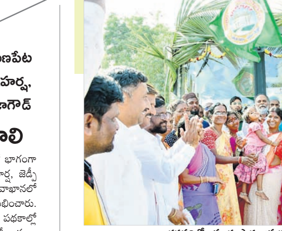
వనపర్తిలో బస్సును ప్రారంభిస్తున్న కలెక్టర్ తేజస్ నందలారీ పవార్

వనపర్తి, డిసెంబర్ 9 : జిల్లా కేంద్రంలోని బస్టాండ్లో మహిళలకు ఉచిత బస్సు ప్రయాణం పథకాన్ని ప్రభుత్వ జనరల్ దవాఖానలో రాజీవ్ ఆరోగ్య శ్రీ పథకాన్ని