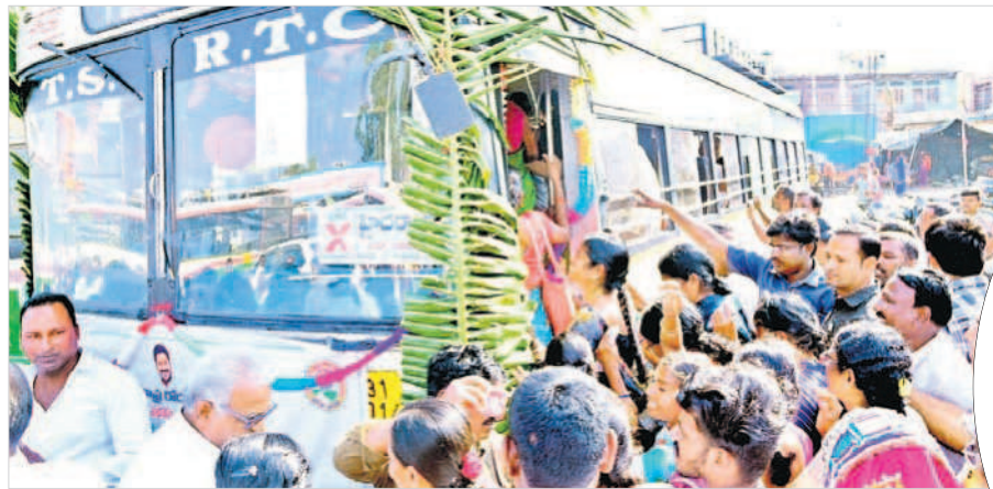
నాగర్ కర్నూల్ లో బస్సు ఎక్కేందుకు పోటీ పడుతున్న మహిళలు