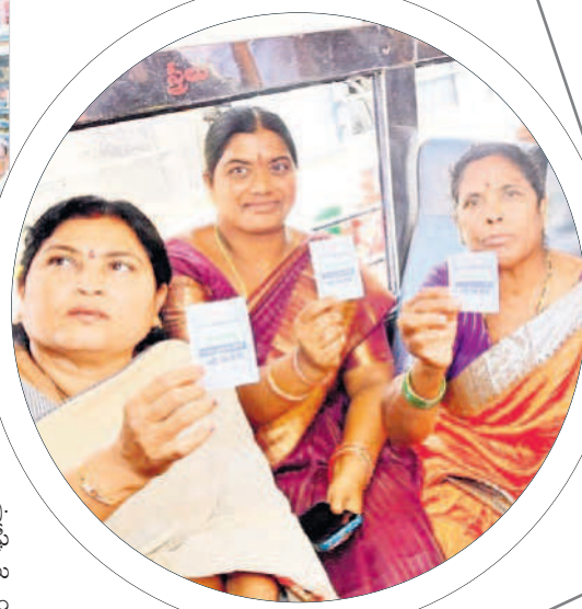
నాగర్ కర్నూల్ లో ఉచిత ప్రయాణ టికెట్ చూపిస్తున్న మహిళలు

ప్రయాణించవచ్చు. పల్లెటూరు, మెట్రో సర్వీసులు, ఎక్స్ ప్రెస్ సర్వీసుల్లో ఉచితంగా ప్రయాణం చేయవచ్చు. మధ్యాహ్నం 2గంటలకు అధికారులు ఆయా బస్టాండ్లలో ఫ్రీ టికెట్లు అందజేశారు. ఈ సందర్భంగా మహిళా ప్రయాణికులు ఆనందం వ్యక్తం చేశారు. కాగా, సీనియర్ సిటిజన్లు, దివ్యాంగులను కూడా ఉచిత బస్సు ప్రయాణం పథకంలో చేర్చాలని డిమాండ్లు వినిపిస్తున్నాయి. ఆరోగ్యశ్రీ పథకానికి శ్రీకారం.. చేయూత కార్యక్రమం కింద రాజీవ్ ఆరోగ్య శ్రీ లో భాగంగా గుర్తించిన అన్ని దవాఖానల్లో రూ.10లక్షల రూపాయల వరకు ఉచిత వైద్యం అందించే పథకానికి శ్రీకారం చుట్టారు. ఈ రెండు పథకాలు మహిళలకు, ముఖ్యంగా వేదలకు ఎంతగానో ఉపయోగపడతాయని, వీటిని సద్వినియోగం చేసుకోవాలని కలెక్టర్లు కోరారు.