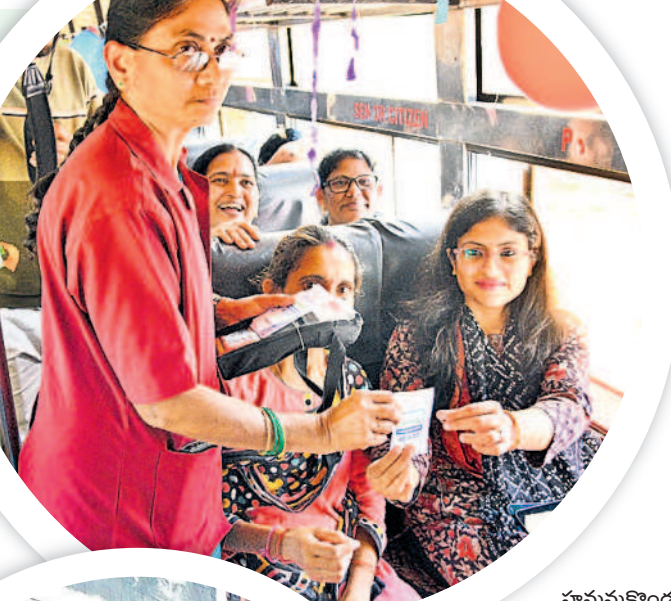
హనుమకొండ కలెక్టర్ సిక్తా పట్నాయక్ జీరో టికెట్ ఇస్తున్న కండక్టర్

కండక్టర్లకు సూచనలు.. ఈ పథకం అమలు చేశారు. తెలంగాణ వ్యాప్తంగా ఉన్న ఆర్టీసీ సిబ్బందికి ప్రత్యేకంగా కొన్ని నిబంధనలు ఉన్నాయి. ప్రయాణికుల రద్దీ వివరంగా పేర్కొంటున్న జాగ్రత్తలను సూచించడంతో పాటు ఎలాంటి విసుగును ప్రదర్శించకుండా బాధ్యతతో వ్యవహరించాలని ఆర్టీసీ ఉద్యోగి