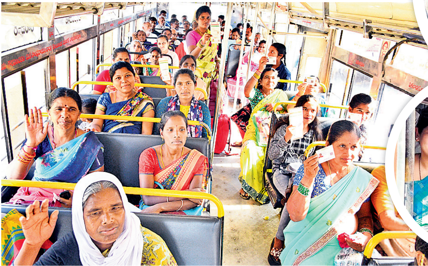
హనుమకొండలో ఆర్టీసీ బస్సులో ఉచితంగా ప్రయాణం చేస్తూ ఆధారకార్లు చూపిస్తున్న మహిళలు