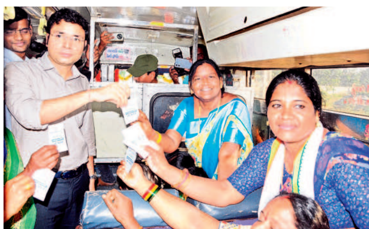
మహిళలకు జీరో టికెట్ ఇస్తున్న జయశంకర్ భూపాలపల్లి కలెక్టర్ భవకీమిత్రా