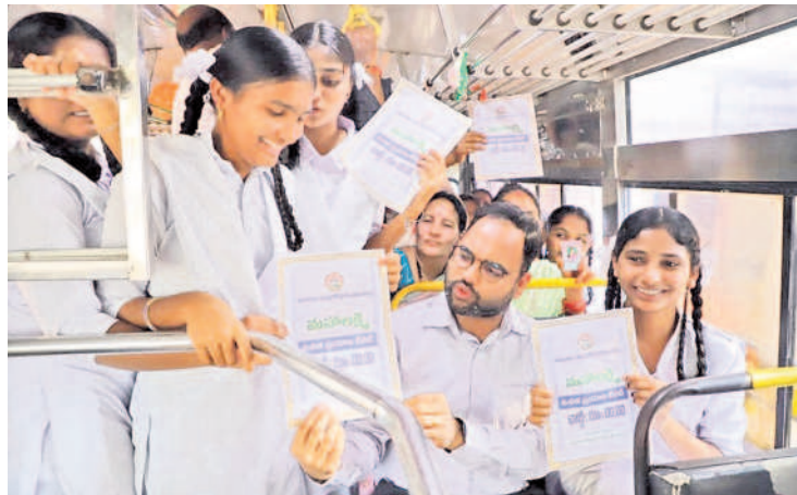
బాలికలతో మహిళాబాబాద్ కలెక్టర్ శశాంక