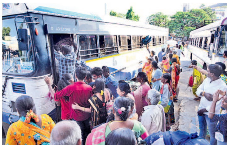
మహిళలతో కలిసి కార్యక్రమం చేపట్టిన బస్సు