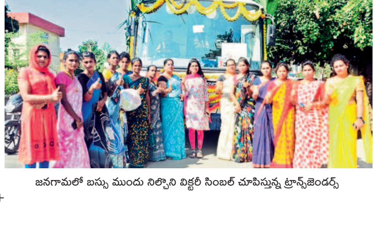
జనగామలో బస్సు ముందు నిల్వని విక్రీతం చేసిన చూపిస్తున్న ట్రాన్స్పోర్ట్