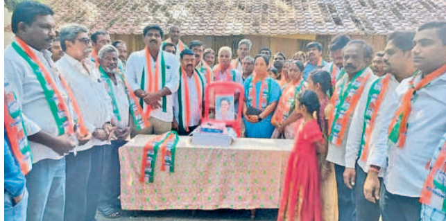
వెంకటాపురం (నూగూరు) : జన్మదిన వేడుకలు నిర్వహిస్తున్న నాయకులు