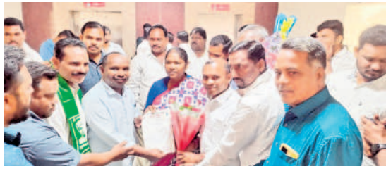
వినతిపత్రం అందజేస్తున్న తుడుందెబ్బ నాయకులు