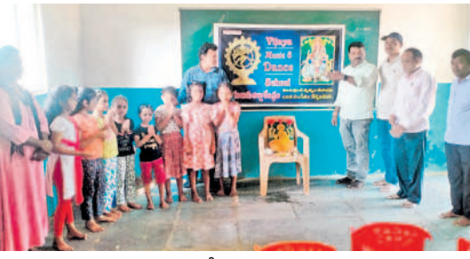
ప్రార్థన చేస్తున్న చిన్నారులు