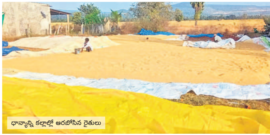
ధాన్యాన్ని కల్లాల్లో ఆరబోసిన రైతులు

■ యంత్రాల సాయంతో పనులు ■ బజీ బజీగా అన్నదాతలు