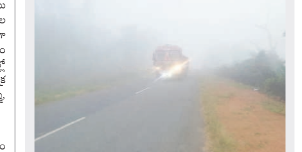
వాజేడు: ప్రగళ్లపల్లి ప్రధాన రహదారిపై పొగమంచు కారణంగా లైట్లు వెనుకొని వెళ్తున్న వాహనాలు

మంగపేట/వాజేడు, డిసెంబర్ 9 : శీతాకాలం ఆగమనంతో మంగపేట, వాజేడు మండలాల్లోని పల్లెలను పొగమంచు కమ్మేసింది. దట్టంగా మంచు అలుముకోవడంతో ఉదయం ఐదుగంటల నుంచి 10 గంటల వరకు సూర్యుడు కనిపించలేదు. పొగమంచు వల్ల రోడ్లపై వాహనదారులు లైట్లు వెనుకొని తక్కువ వేగంతో ప్రయాణించడం కనిపించింది. కోత దశకు వచ్చిన పరి పొలాలపై మంచు దుప్పటిలా కమ్మేయడంతో ఆహ్లాదకరమైన వాతావరణం కనిపించింది.