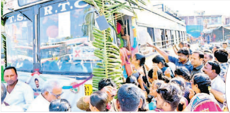
నాగర్ కర్నూల్ లో బస్సు ఎక్కేందుకు పోటీ పడుతున్న మహిళలు