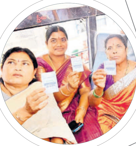
నాగర్ కర్నూల్ లో ఉచిత ప్రయాణ టికెట్ చూపిస్తున్న మహిళలు