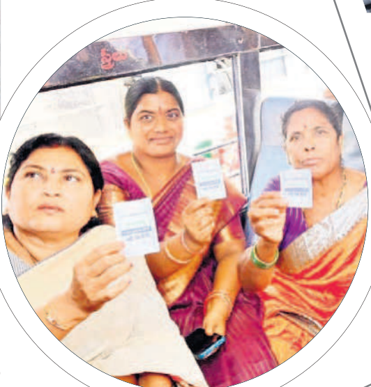
నాగర్ కర్నూల్ లో ఉచిత ప్రయాణ టికెట్ చూపిస్తున్న మహిళలు