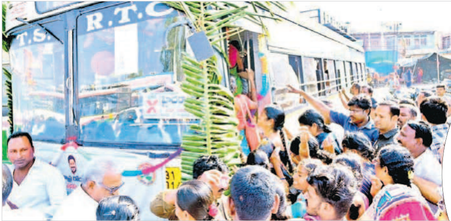
నాగర్ కర్నూల్ లో బస్సు ఎక్కేందుకు పోటీ పడుతున్న మహిళలు