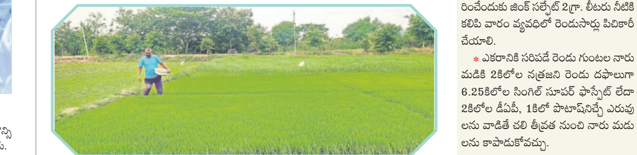
చలికాలం వచ్చే సరికి రెండు గుంటల నారు మడికి 2కిలోల సరఫరా రెండు దశలూగా 6.25కిలోల సింగిల్ సూపర్ ఫాస్ఫేట్ లేదా 2కిలోల డిఎఫ్ 1, 1కిలో ఫాటాఫోస్ఫేట్ ఎరువులను వాడితే చలి తీవ్రత నుంచి నారు మడులను కాపాడుకోవచ్చు.

అధికారుల సలహాలు పాటించాలి ప్రస్తుతం ఉన్న వాతావరణ పరిస్థితులను దృష్టిలో పెట్టుకొని నారు మడులో సాయంత్రం వేసిన నీటిని ఉదయం తొలగించాలి. చలి తీవ్రత నుంచి నారును దీని కాపాడుకోవాలి. శాస్త్రవేత్తలు, వ్యవసాయ అధికారుల సలహాలు తీసుకుంటే మంచిది. నారు మడికి కావాల్సిన వచ్చడనం అందించే ఎరువులను వాడుకుంటే ఫలితం ఉంటుంది. - డా.నాన్నా కేశిక్ శాస్త్రవేత్త