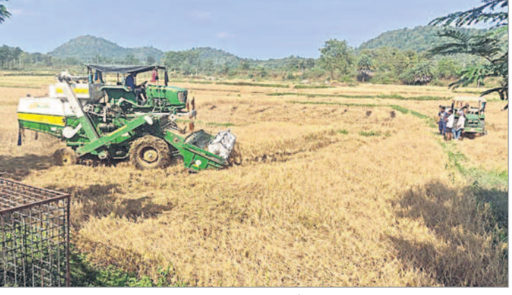
వరి పంట కోస్తున్న హార్వెస్టర్

దస్తూరాబాద్, డిసెంబర్ 9 : కడెం ప్రాజెక్ట్ ఆయకట్టు కింద, బోర్లు, బావుల ద్వారా రైతులు వాసకాలం వరి పంటను సాగు చేశారు. పంటల చేతికి రావడంతో మండలంలో రైతులు తమ తమ పంటల్లో సాగు చేసిన వరి పంట కోతను ప్రారంభించారు. కాగా ప్రస్తుతం వరి కోత పనులు ముమ్మరంగా సాగుతున్నాయి. రైతులు హార్వెస్టర్ యంత్రాలను ఆశ్రయిస్తున్నారు. కాగా ట్రైల్ వరి కోత యంత్రానికి రూ. 1800 నుంచి రూ. 2000 వరకు, చైన్ వరి కోత యంత్రానికి రూ. 3200 నుంచి రూ. 3500 వరకు ధర ఉంది. పంటలు సమ్మద్ది పండడంతో రైతులు సంతోషం వ్యక్తం చేస్తున్నారు. సెకరించిన ధాన్యాన్ని ట్రాక్టర్ల ద్వారా తమ తమ ఇంటి వద్దకు, కొనుగోలు కేంద్రాలకు తరలిస్తున్నారు.