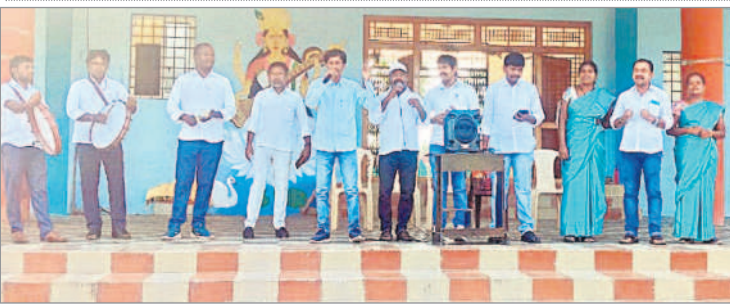
పరిశుభ్రతపై వివరిస్తున్న కళాకారులు

పరిశుభ్రత పాటించాలి ఇంద్రవెల్లి, డిసెంబర్ 9 : చదువుతోపాటు వ్యక్తిగత పరిశుభ్రత పాటించాలని విద్యార్థులకు తెలంగాణ సాంస్కృతిక సారథి కళాకారులు పాటల ద్వారా అవగాహన కల్పించారు. శనివారం ముత్తూర్ గిరిజన బాలికల కళాశాలలో తెలంగాణ సాంస్కృతిక సారథి కళాకారులు అవగాహన