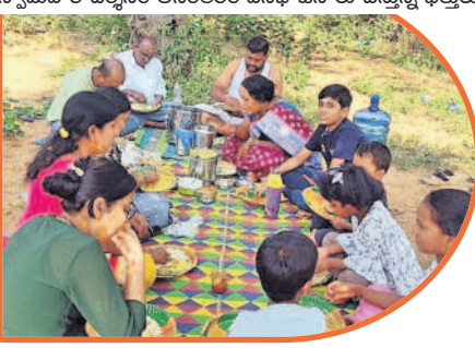
స్వామివారి దర్శనం అనంతరం వనభోజనాలు చేస్తున్న భక్తులు