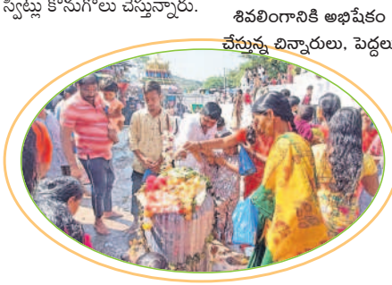
శివలింగానికి అభిషేకం చేస్తున్న బిన్నారలు, పెద్దలు