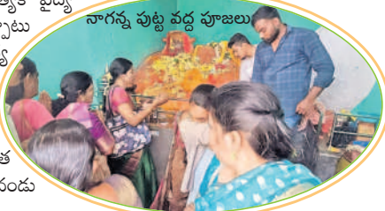
నాగన్న పుట్ట వద్ద పూజలు