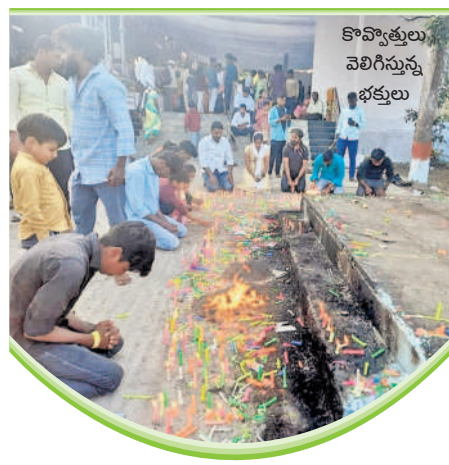
కొవ్వొత్తులు వెలిగిస్తున్న భక్తులు