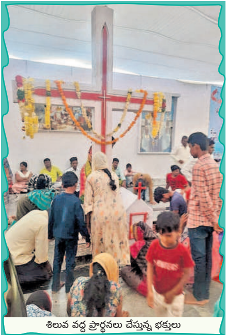
శిలువ వద్ద ప్రార్థనలు చేస్తున్న భక్తులు

ధారూరు, డిసెంబర్ 9 : ధారూరు మండల పరిధిలోని ధారూరు స్టేషన్- డోర్నాల్ గ్రామాల మధ్య ఉన్న మెథడిస్టు క్రీస్టియన్ జాతరకు భక్తులు శనివారం పోటీపడ్డారు. ధారూరు మెథడిస్టు జాతరకు వివిధ ప్రాంతాల నుంచి వేలాది మంది భక్తులు కాలినడకన తరలివస్తున్నారు. మెథడిస్టు జాతర రేవు (ఆదివారం) ముగింపు ఉండడంతో శనివారం అధిక సంఖ్యలో భక్తులు తరలివచ్చారు. యాత్రికులు జాతర ప్రాంగణంలో రెండు రోజులు ఉండేందుకు గుడారాలను ఏర్పాటు చేసుకున్నారు. ఏస్తుక్రీస్తు శిలువ వద్ద ప్రత్యేక ప్రార్థనలు చేసి మొక్కులు చెల్లించుకున్నారు. ప్రార్థన మందిరంలో ప్రార్థనలు చేసి బిబిఎల్ దైవ సందేశాన్ని తెలుగు, కన్నడ భాషలలో విని పించారు. వివిధ ప్రాంతాల నుంచి వచ్చిన భక్తులు సందేశాన్ని వింటూ ఏనుప్రభువును తలచుకున్నారు. భక్తులు శిలువ వద్ద కొవ్వొత్తులను వెలిగించి ప్రత్యేక ప్రార్థనలు చేశారు. ఆదివారం మెథడిస్టు జాతర ముగియనున్నందున భక్తులు అధిక సంఖ్యలో వచ్చే అవకాశాలున్నాయని నిర్వాహకులు తెలుపుతున్నారు. యాత్రికులకు ఎలాంటి ఇబ్బందులు తలెత్తకుండా పోలీసులు భారీ బందోబస్తు చేస్తున్నారు.