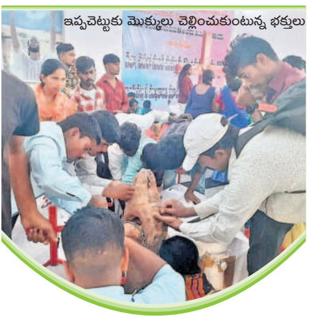
ఇప్పచెట్టుకు మొక్కులు చెల్లించుకుంటున్న భక్తులు