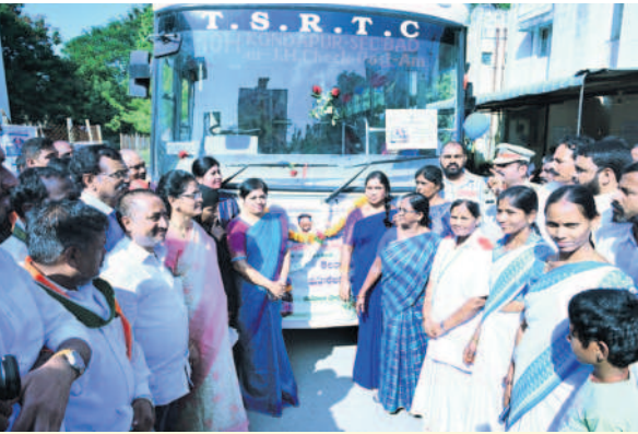
మహిళలకు ఉచిత ప్రయాణం సద్వినియోగం చేసుకోవాలి