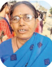
- బాలమ్మ, కొడంగల్, వికారాబాద్

ఎవరు మంచి చేసినా బాగానే ఉంటుంది. కొడంగల్ నుంచి బస్ చార్జీ లేకుండా ప్రీగా వచ్చాను. మొయినాబాద్ కు బతుకు దెరువు కోసం వచ్చాం. నెలకు రెండుసార్లు ఊరికి వెళ్తాం. పోవడానికి, రావడానికి రూ.300 అవుతుంది. నా బిడ్డ నేను ఇద్దరం ఊరికెళ్లి మళ్ళీ మొయినాబాద్ వచ్చాం. ఇద్దరికీ కలిపి రూ.3 వందలు మిగిలాయి. ఆధార్ కార్డు చూపించి బస్ లో ప్రీగా వచ్చాము. చాలా సంతోషంగా ఉంది. ఉన్నవాళ్ల ఆడ పిల్లలు బస్ లో ఎక్కరు. పేదోళ్లు మాత్రమే ఎక్కరు. పేదోళ్లు ఇది చాలా మంచిది.