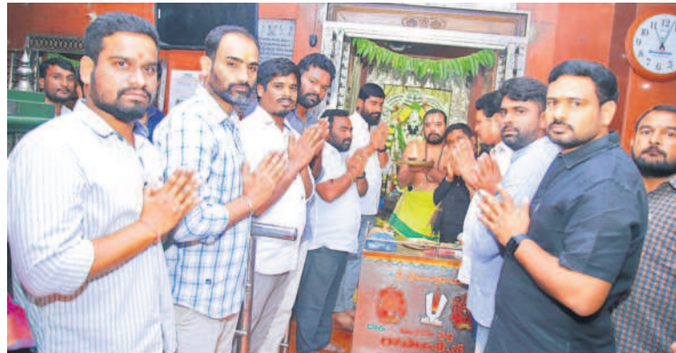
సిద్దిపేట వేంకటేశ్వరాలయంలో పూజలు చేస్తున్న బీఆర్ఎస్ యువజన, విద్యార్థి విభాగం నాయకులు