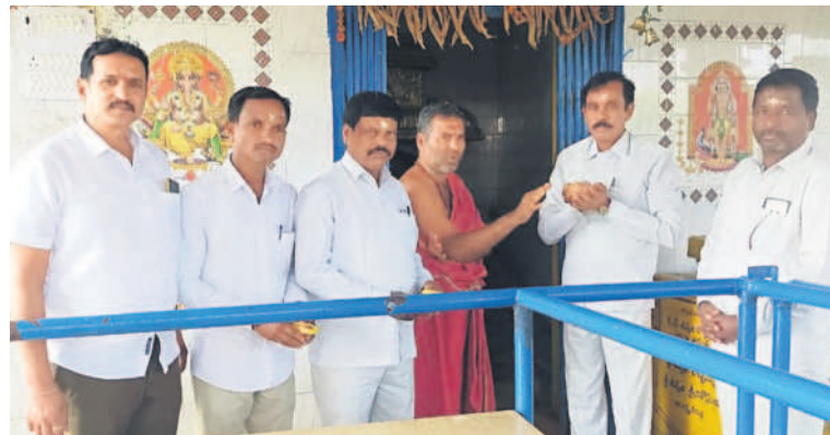
నారాయణరావుపేట: బుగ్గరాజేశ్వరస్వామి ఆలయంలో పూజలు చేస్తున్న బీఆర్ఎస్ నాయకులు