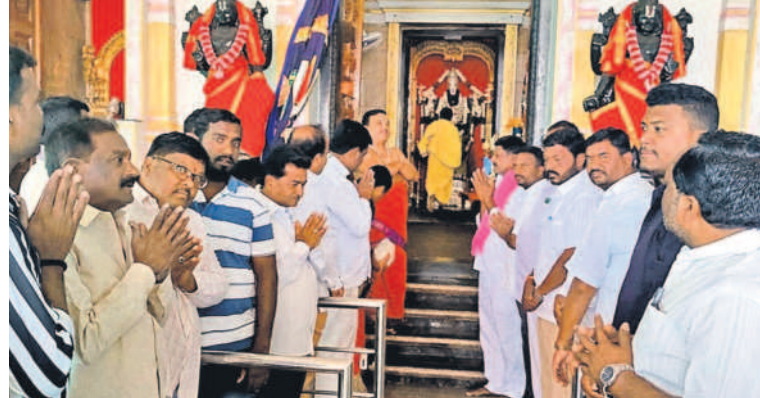
దుబ్బాక టౌన్: బాలాజీ దేవాలయంలో పూజలు చేస్తున్న మునిపల్లె చైర్మన్ వనిత, బీఆర్ఎస్ శ్రేణులు