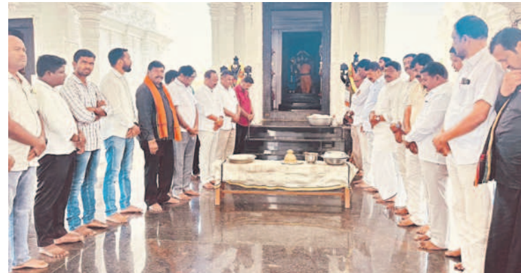
సంగనూరు: కోనాయపల్లి వేంకటేశ్వరస్వామి ఆలయంలో పూజలు చేస్తున్న బీఆర్ఎస్ నాయకులు