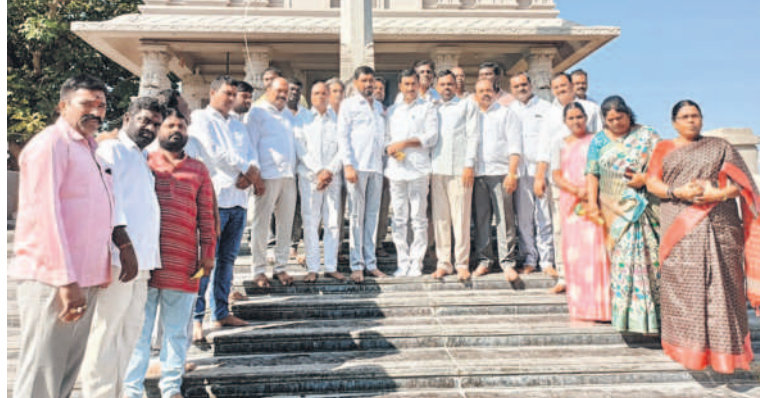
గజ్వేల్లోని మహంకాళి అమ్మవారి ఆలయంలో పూజలో పాల్గొన్న వంటేరు ప్రజావరెడ్డి, నాయకులు