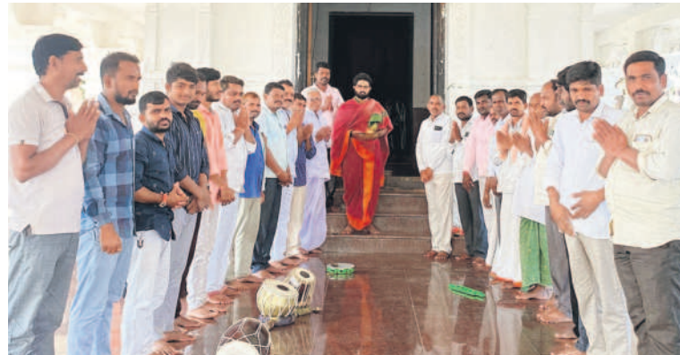
సిద్దిపేటరూరల్: చింతమడక పట్టాభిరాముడి ఆలయంలో పూజలు నిర్వహిస్తున్న సర్పంచ్, గ్రామస్థులు