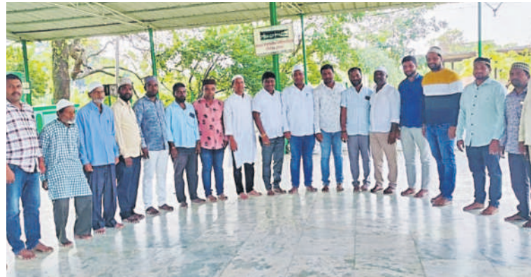
గజ్వేల్ లోని దర్గాలో ప్రార్థనలు చేస్తున్న ముస్లింలు