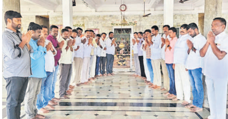
తోగుట మండలం రాంపూర్ స్పటిక లింగేశ్వరాలయంలో ప్రత్యేక పూజలు చేస్తున్న బీఆర్ఎస్ శ్రేణులు