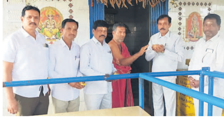
నారాయణరావుపేట: బుగ్గరాజేశ్వరస్వామి ఆలయంలో పూజలు చేస్తున్న బీఆర్ఎస్ నాయకులు