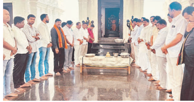
సంగనూరు: కోనాయపల్లి వేంకటేశ్వరస్వామి ఆలయంలో పూజలు చేస్తున్న బీఆర్ఎస్ నాయకులు