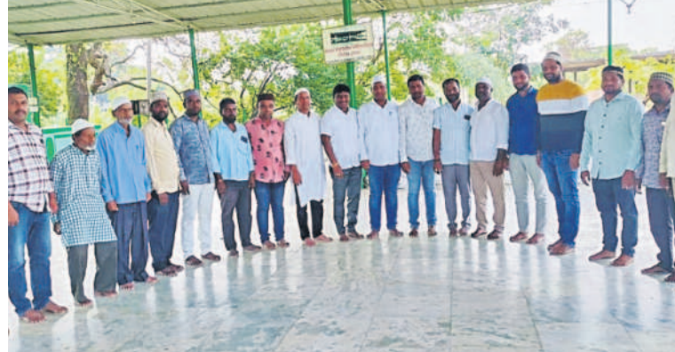
గజ్వేల్ లోని దర్గాలో ప్రార్థనలు చేస్తున్న ముస్లింలు